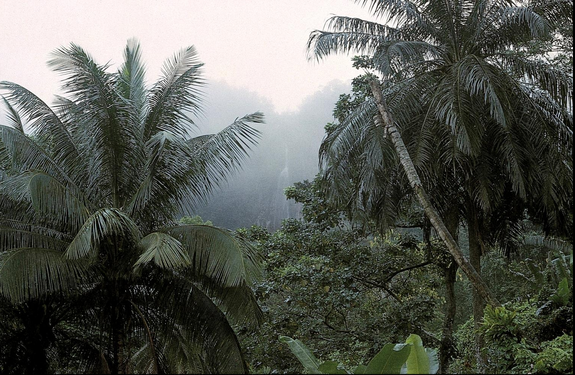
Palmeiras andim sobressaem na mata secundária (1965)