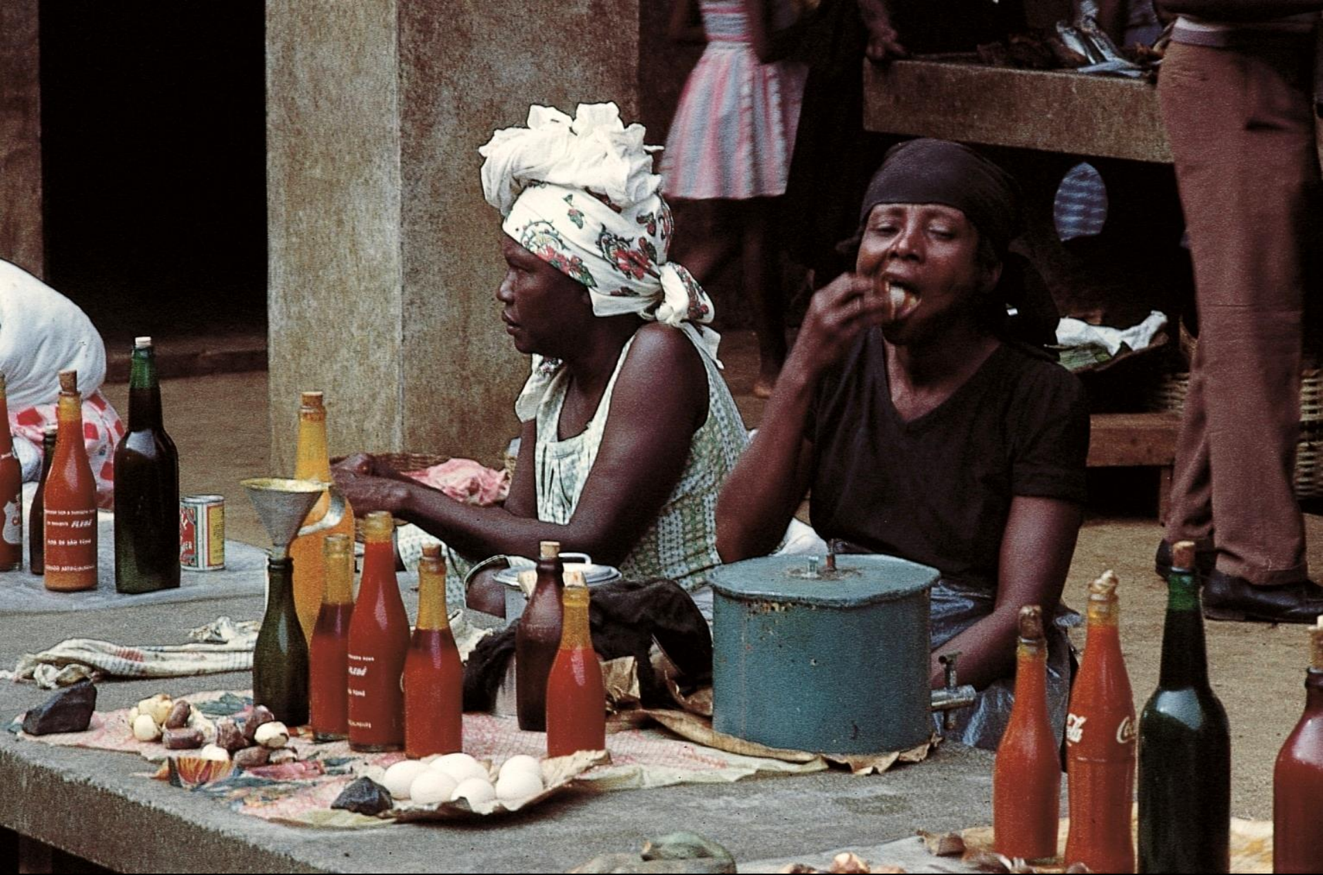
Mercado de óleos de palmeira (1965)