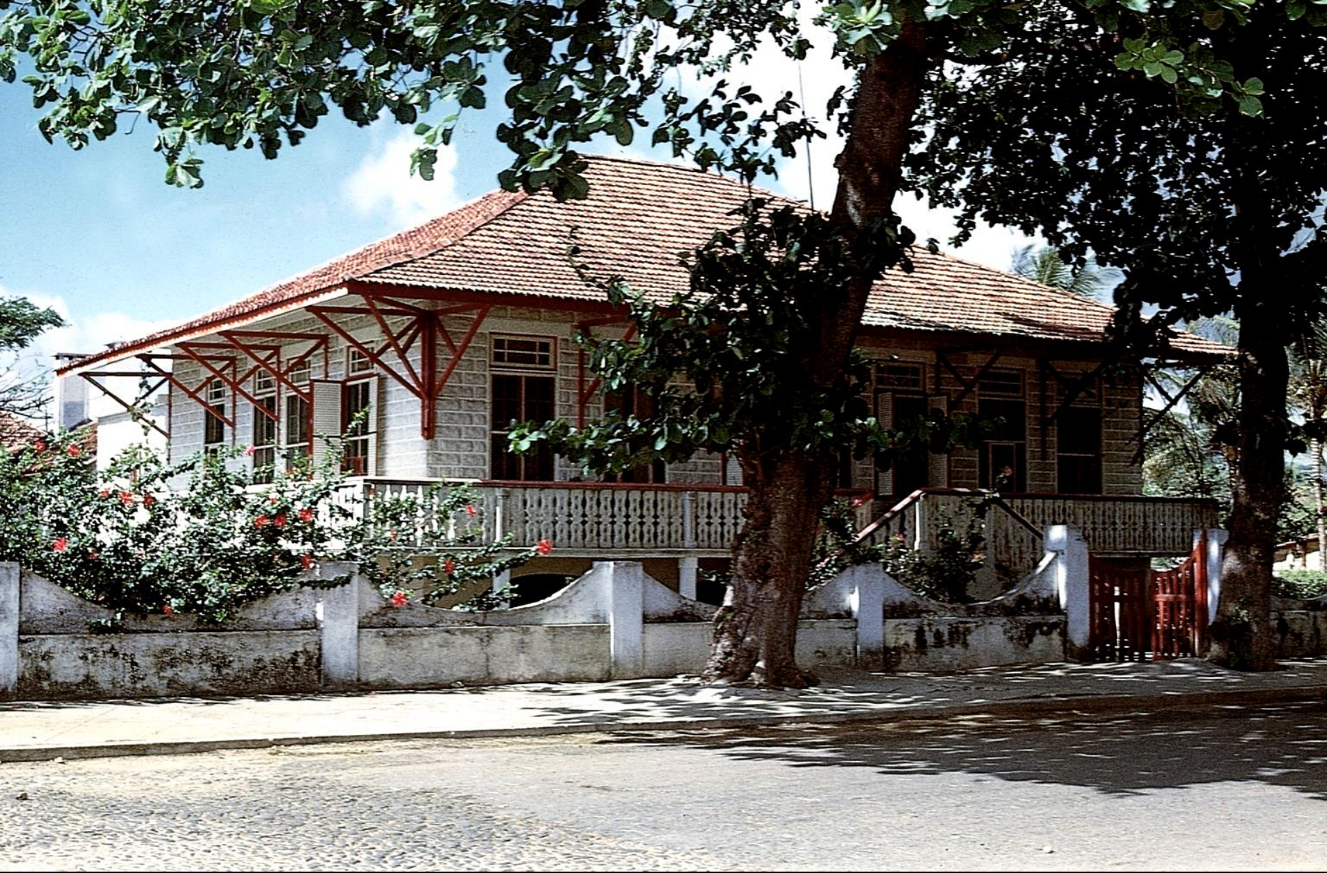
Casa na cidade de São Tomé (1966)