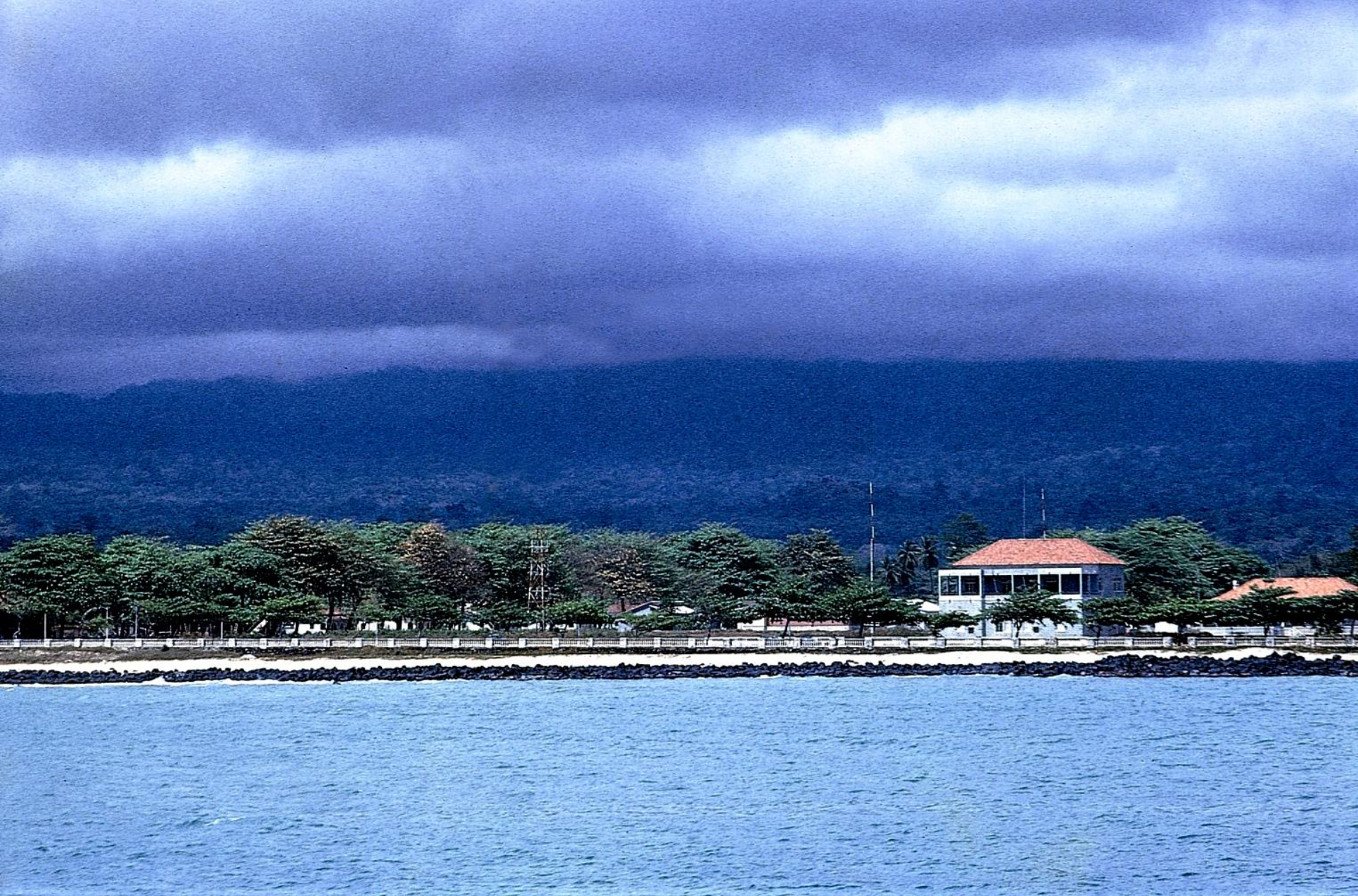
Marginal da cidade, vista da baía (1965)