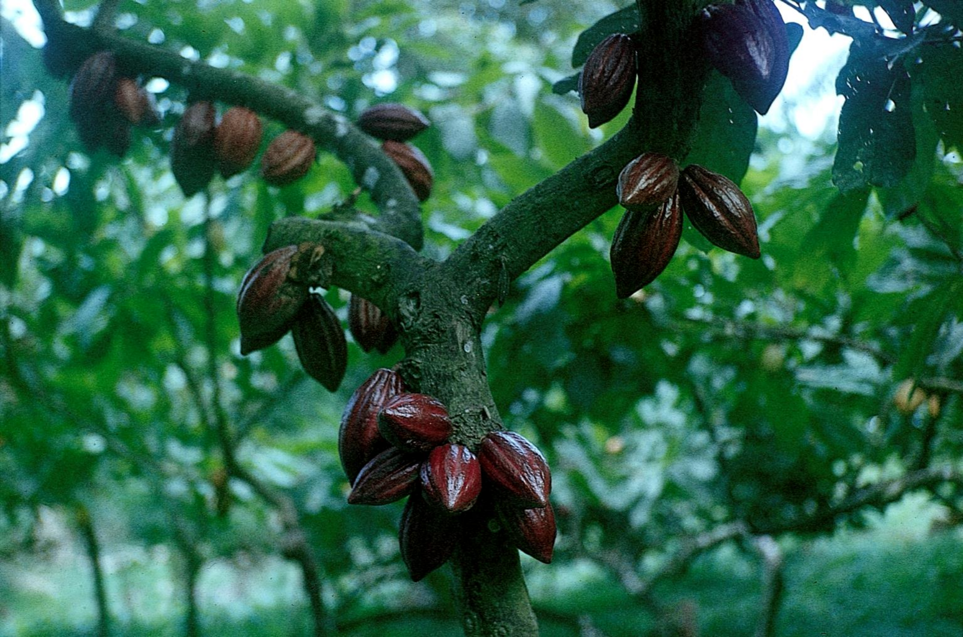
Frutos maduros de cacau (1966)