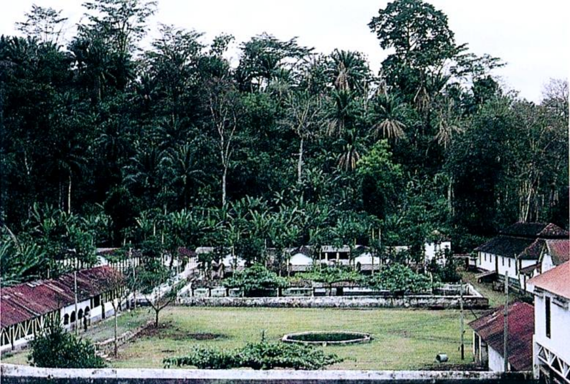
Roça Rio do Ouro, aspecto parcial (1965)