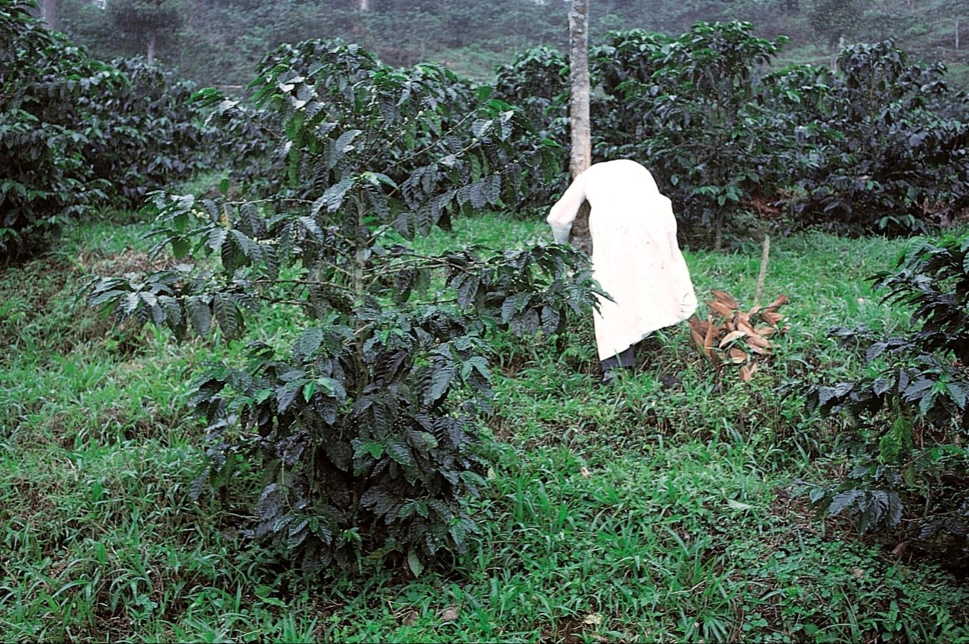
Cafezal, São Tomé (1965)