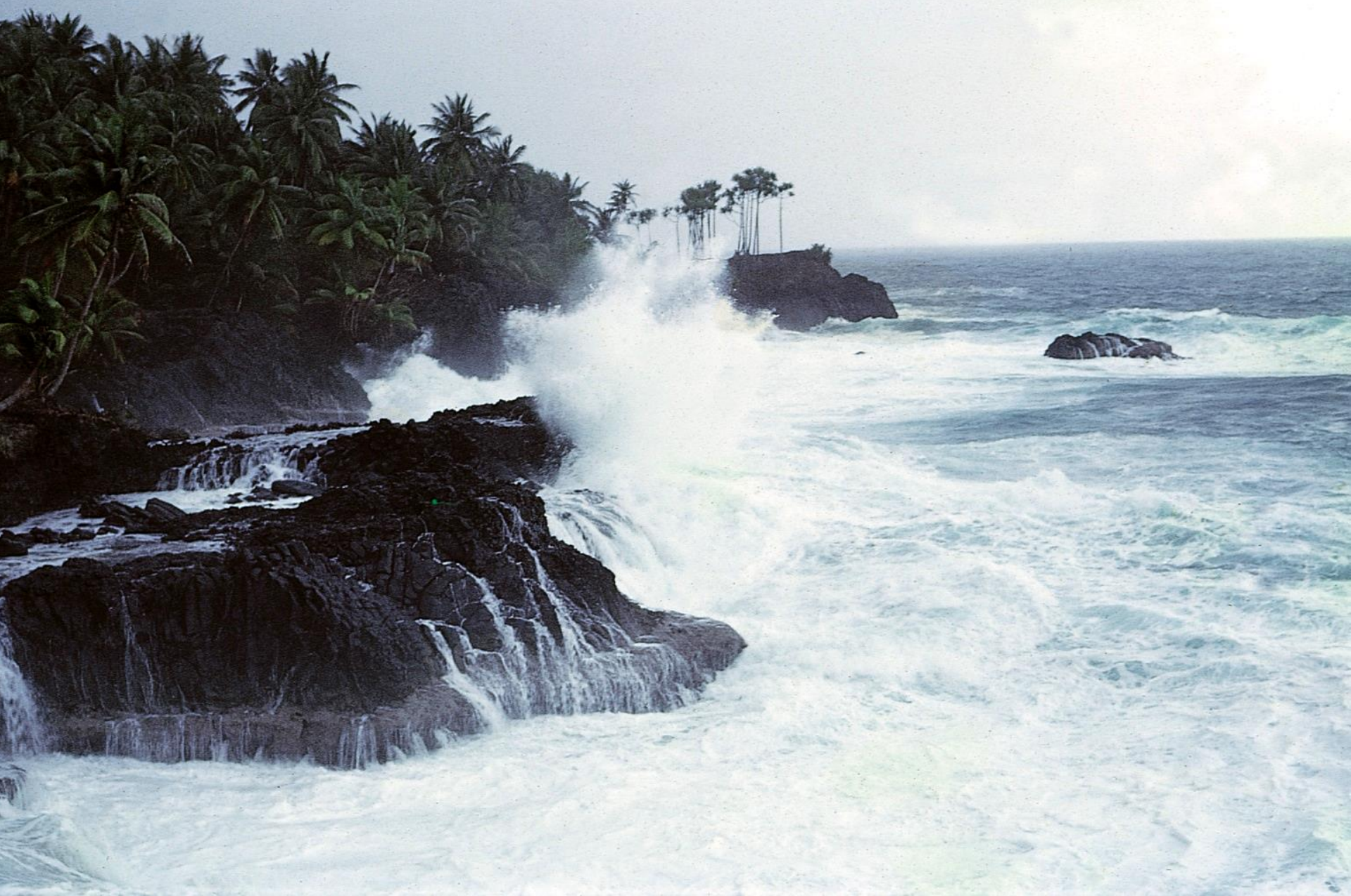
Tempestade no início do Outono de 1965