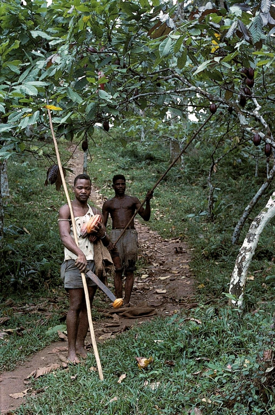
Apanhadores de cacau (1965)