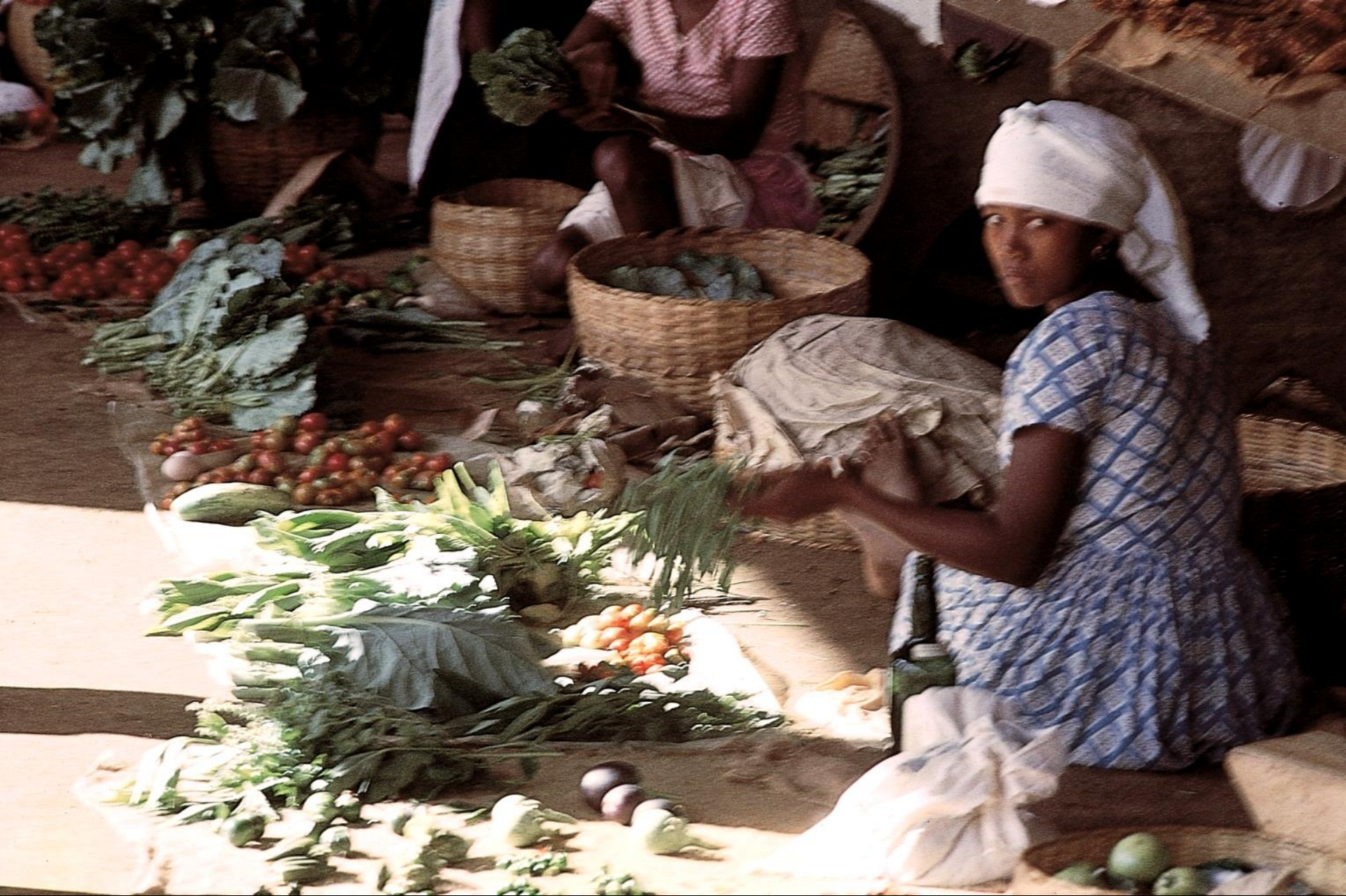
Mercado de legumes, São Tomé (1965)