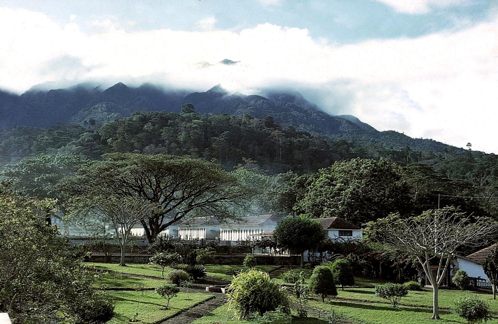
Roça Rio do Ouro, uma das maiores de São Tomé (1965)