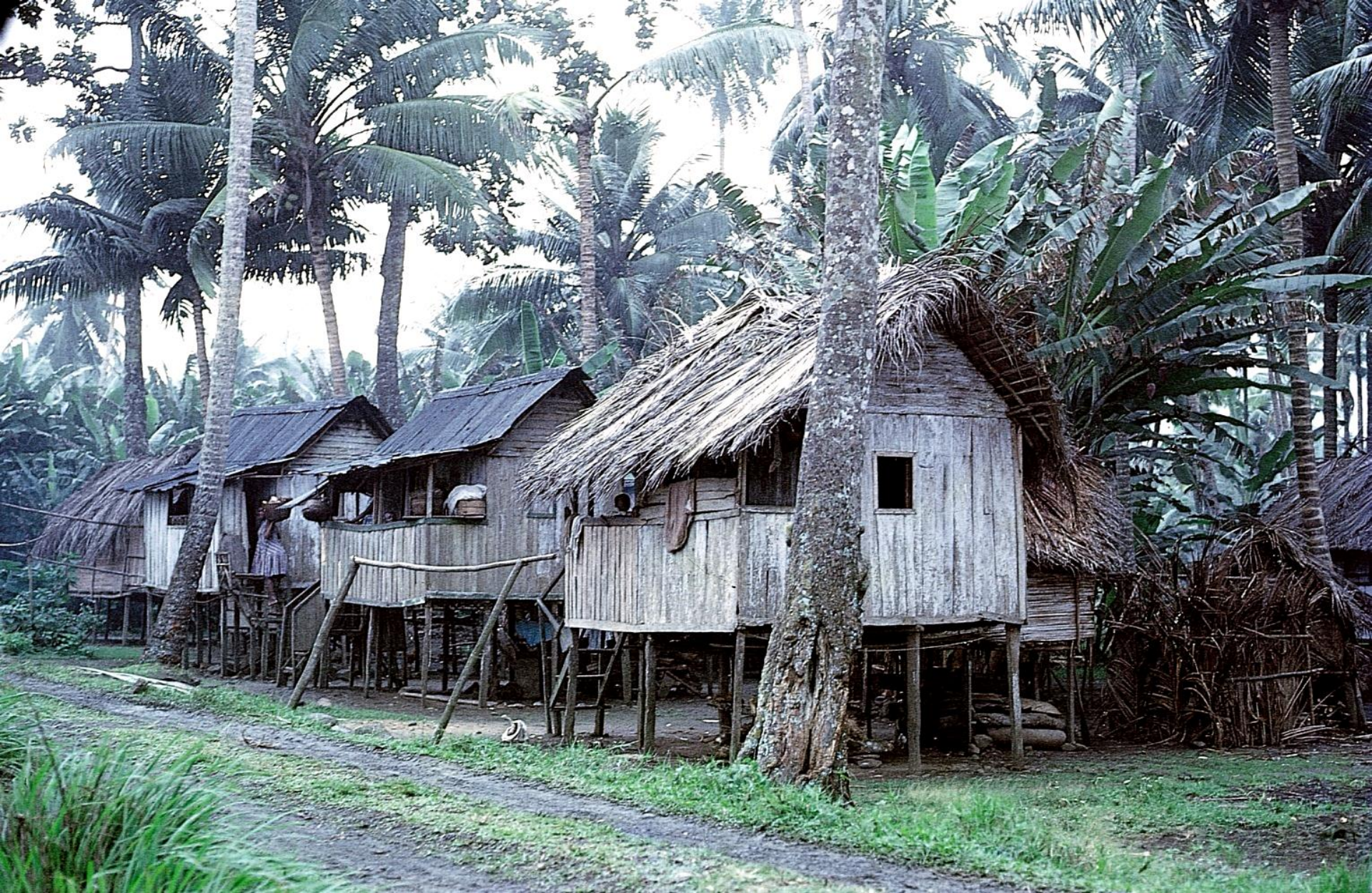
Cabanas de pescadores, como sempre, assentes sobre pilares (1965)