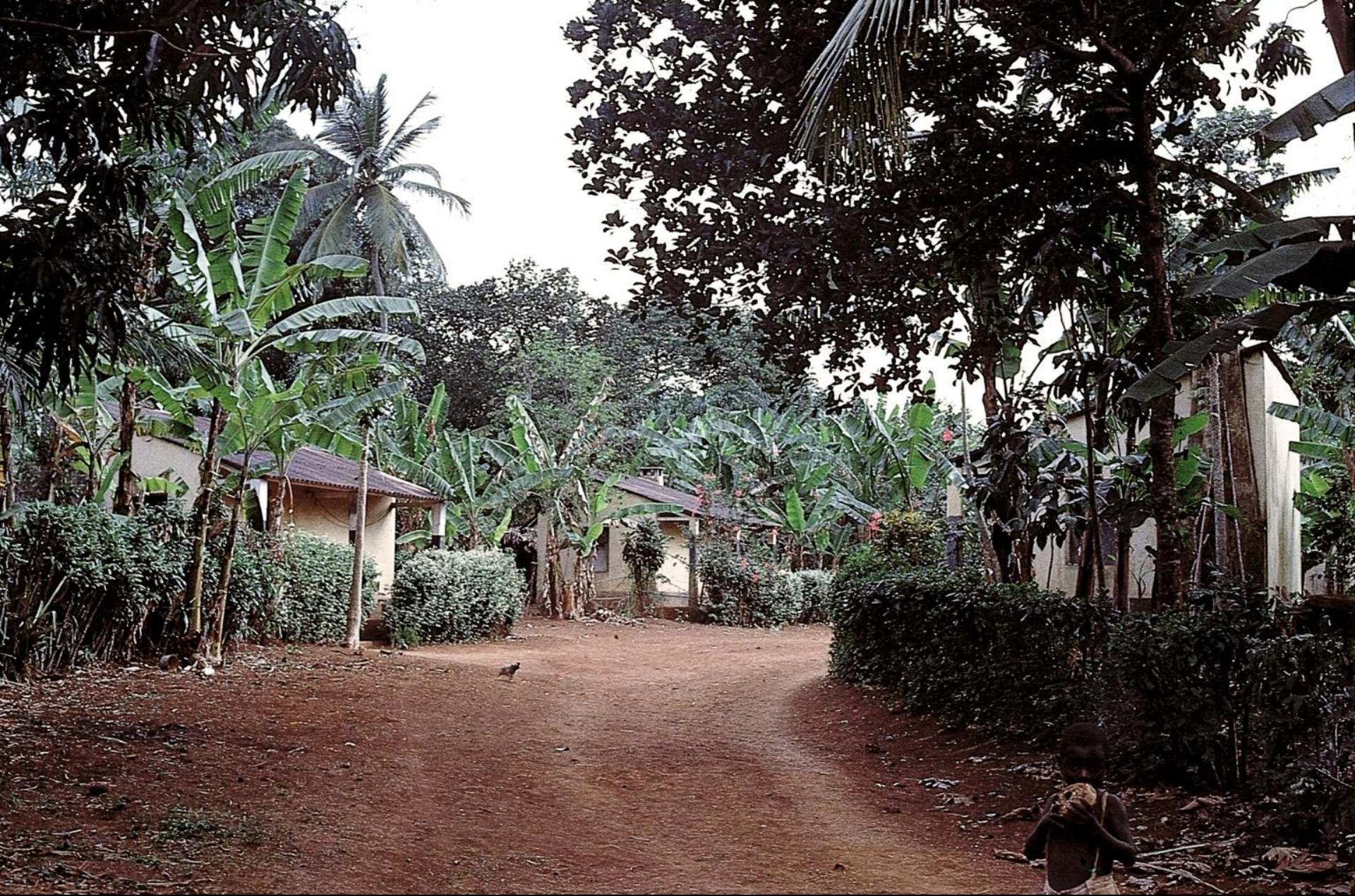
Povoação ao longo de um caminho, São Tomé (1965)