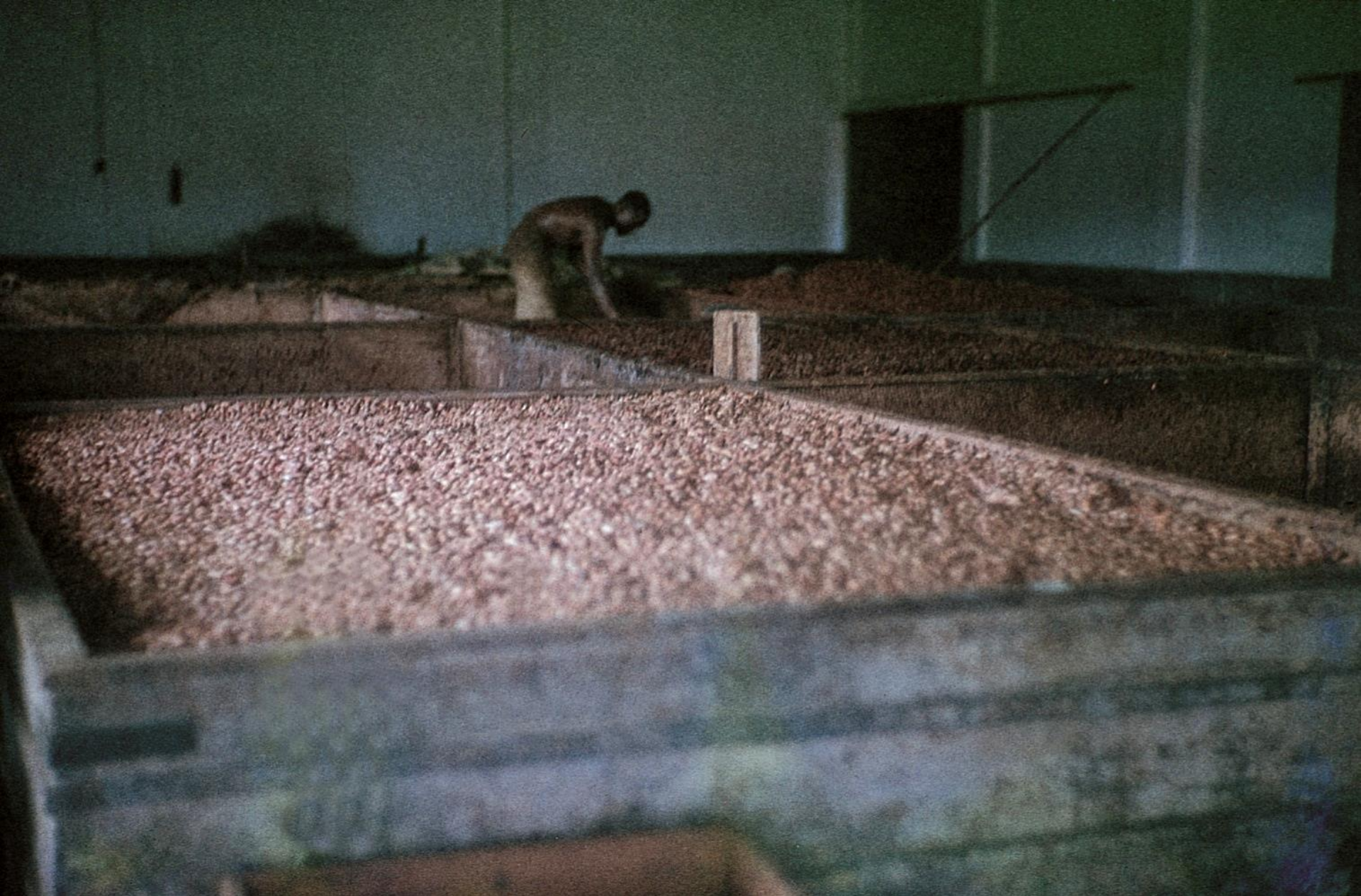
Tabuleiros para a seca de cacau (1966)