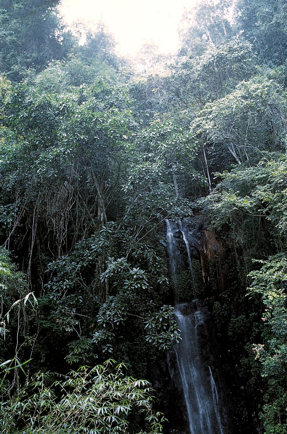
Cascata no centro da ilha (1965)