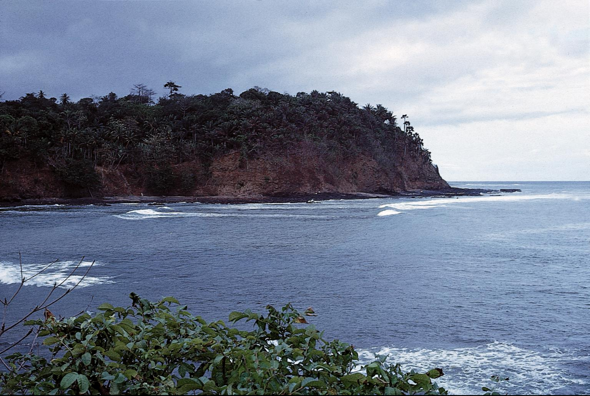
Arribas basálticas e palmeiras (1966)