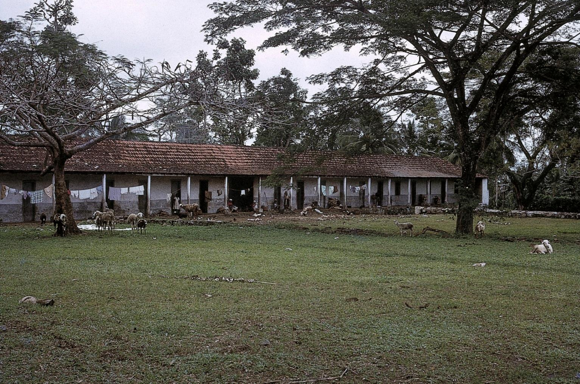
Casas de trabalhadores de roça (1965)