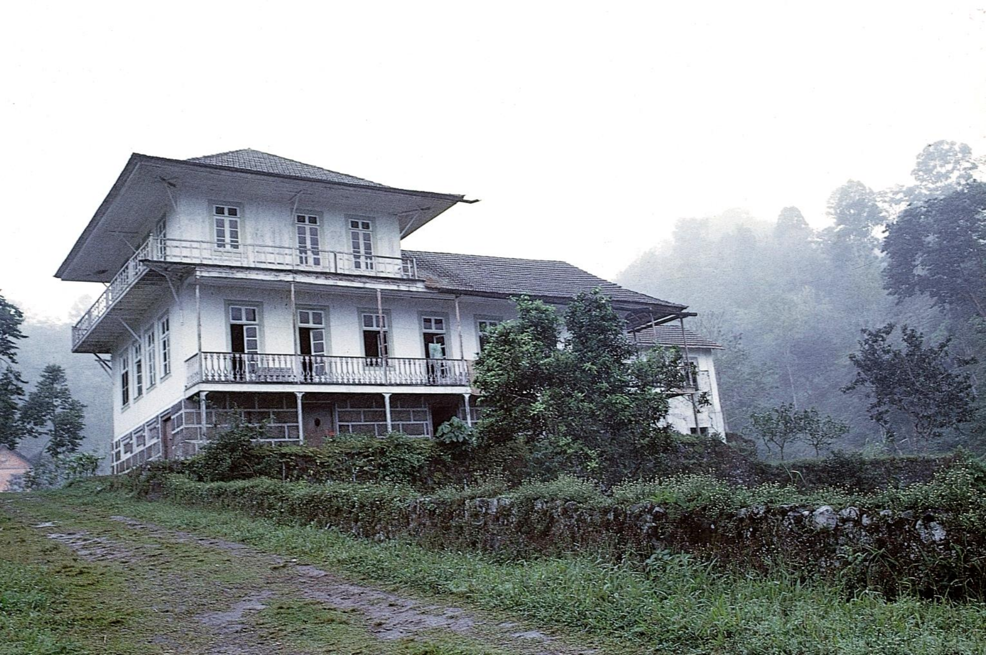
Casa grande numa roça de São Tomé (1966)