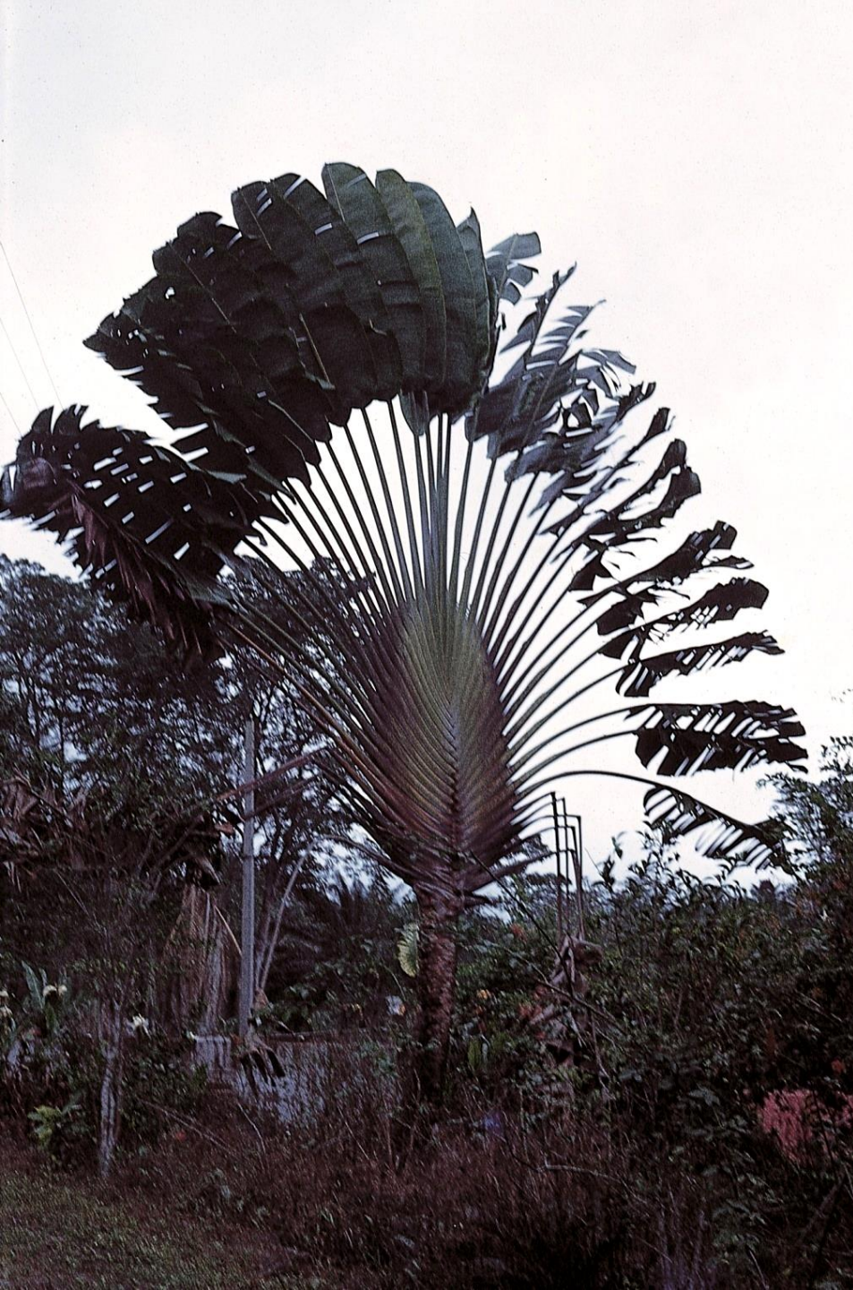
Palmeira leque , numa roça de São Tomé (1965)