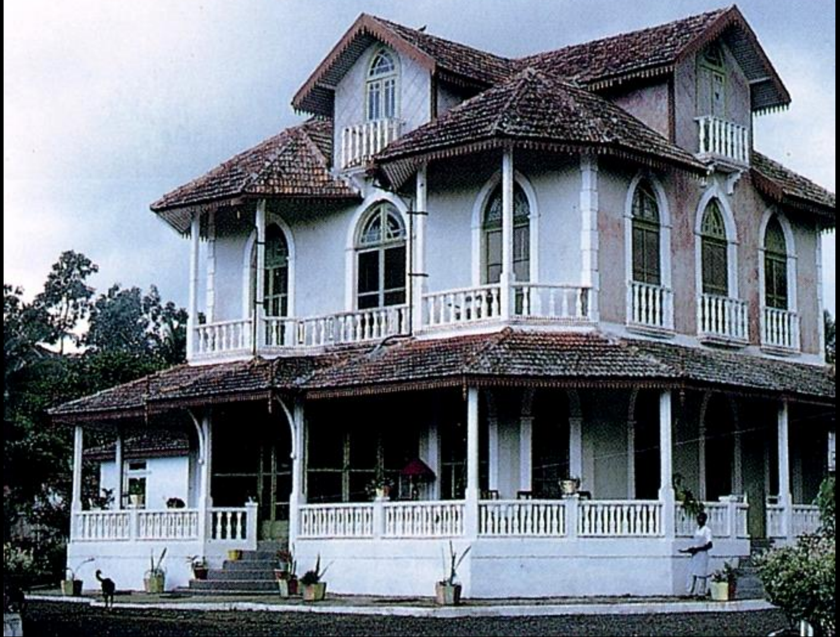
Príncipe, casa grande (1965)