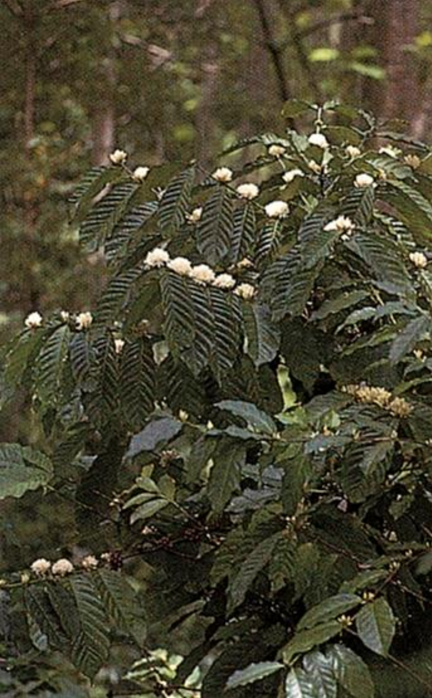
Flor de café (1965)