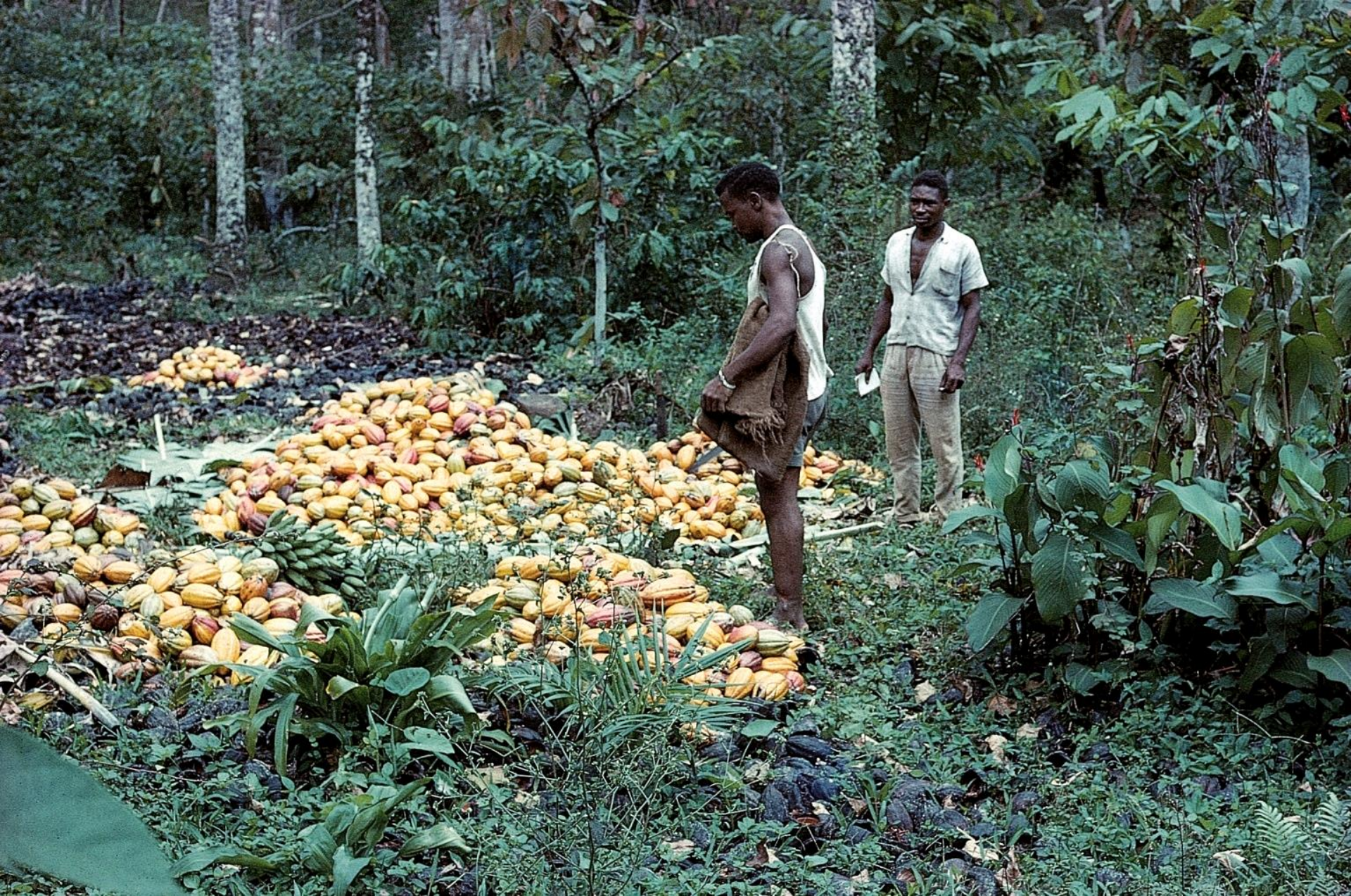
Cacau pronto para a seca nos tabuleiros (1965)