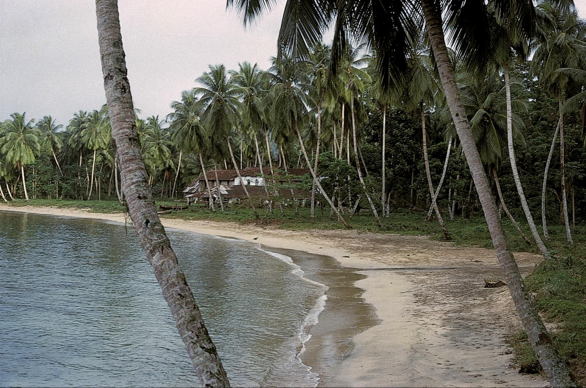
São Tomé, cabanas de pescadores (1965)