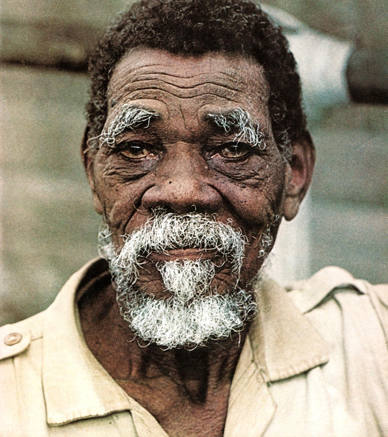
Pescador de São Tomé (1965)