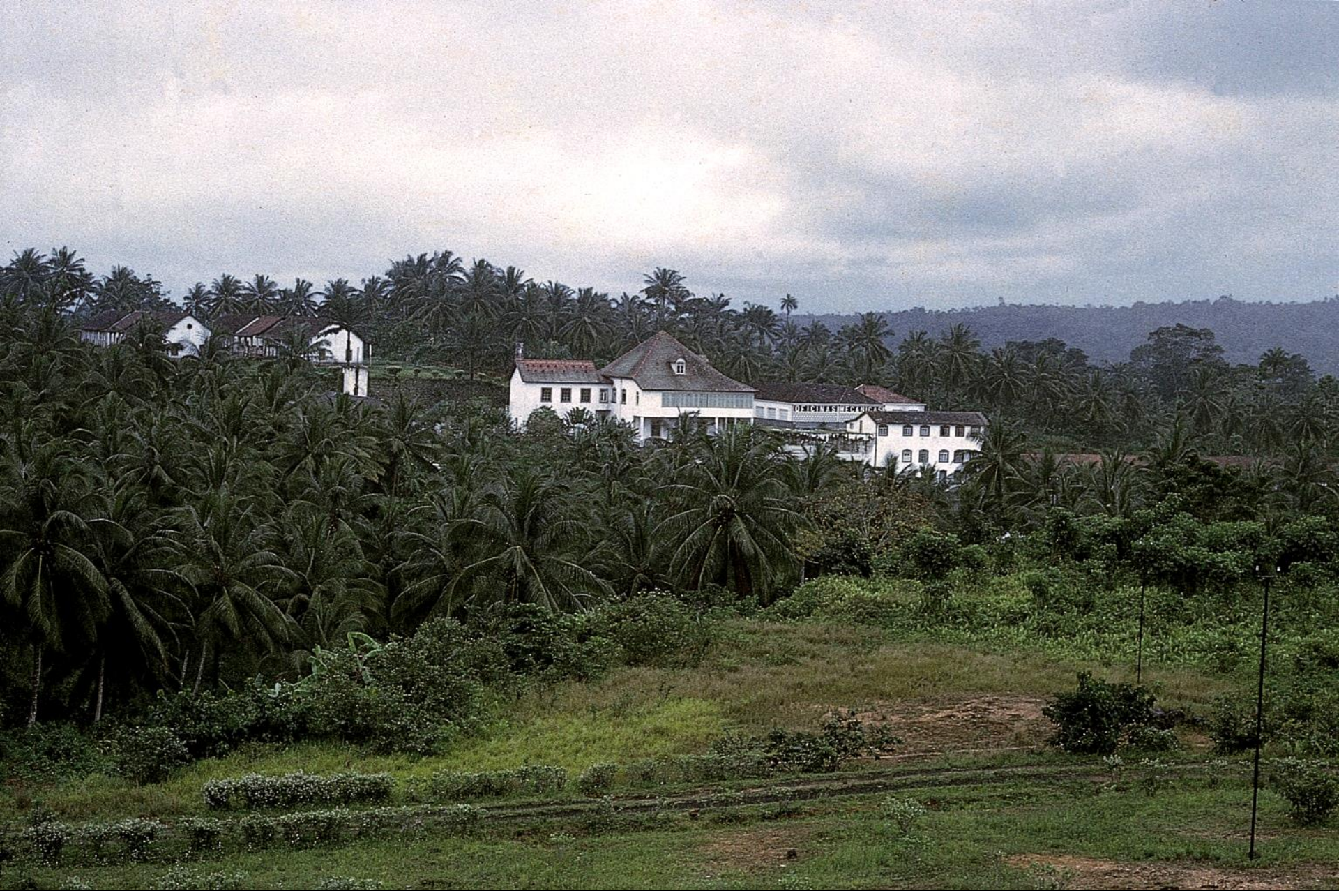
Casa grande e palmar, numa roça em São Tomé (1966)