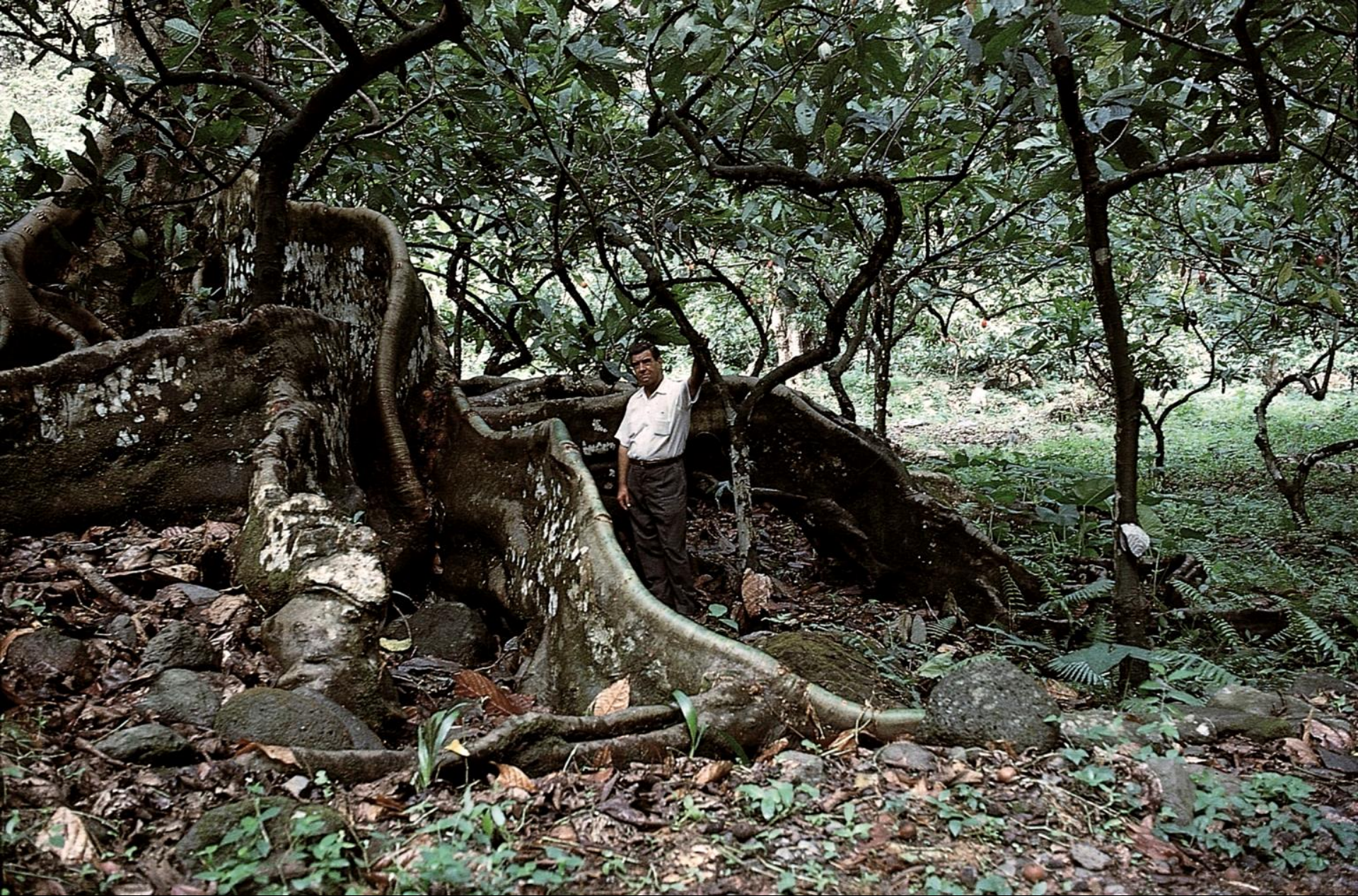
Árvores com raízes gigantescas, mas frágeis (1966)