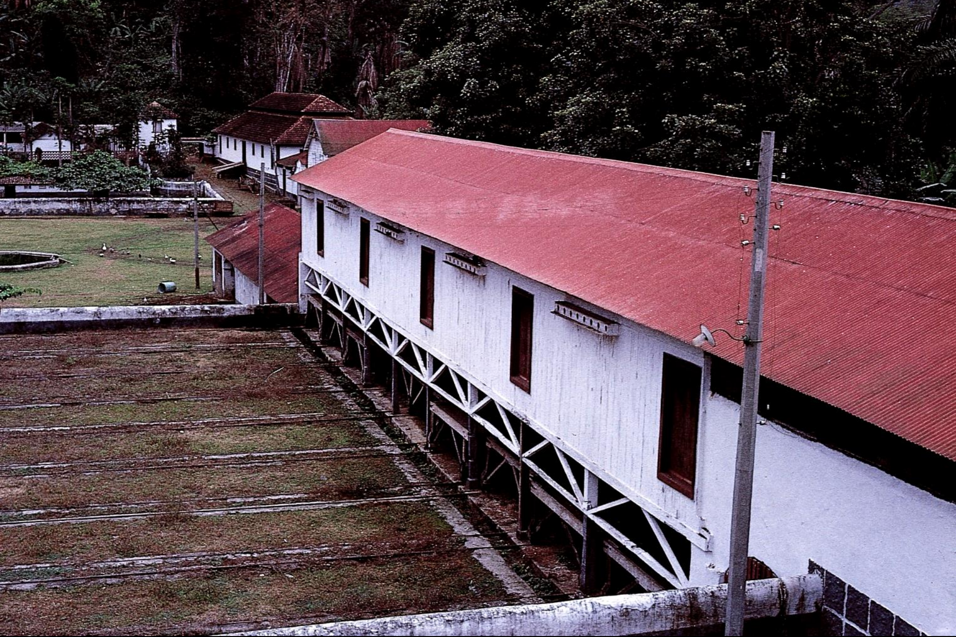
Tabuleiros para seca de cacau ao ar livre (1966)