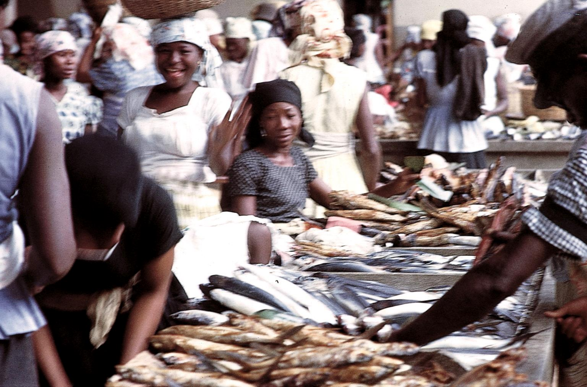
Mercado de Peixe, São Tomé (1965)