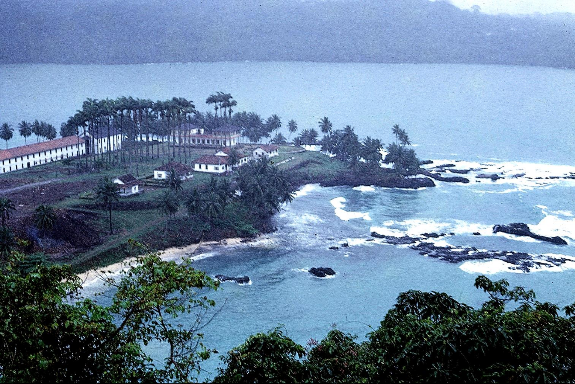
Grande roça no sueste de São Tomé (1966)