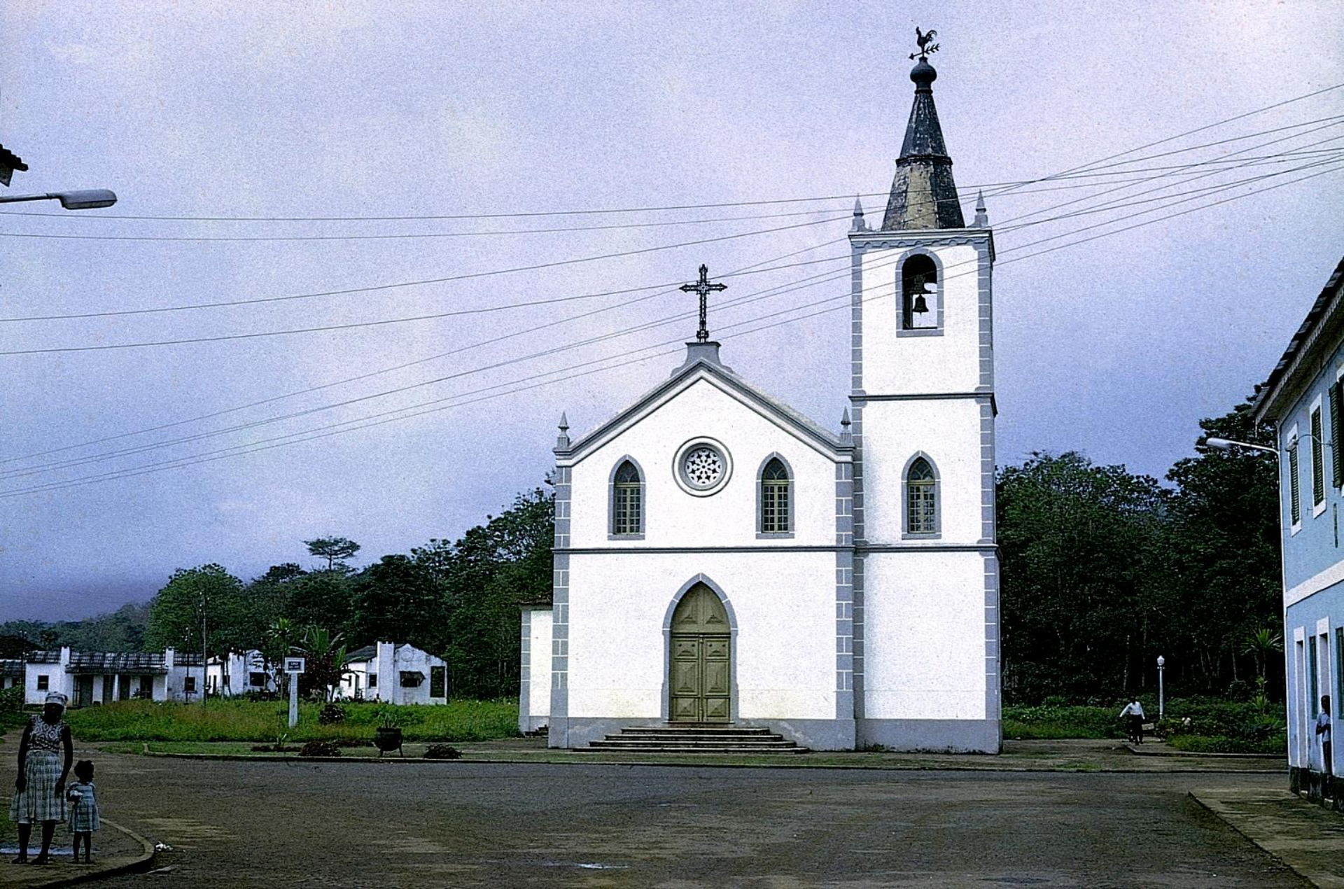
Príncipe, igreja de Santo António (1965)