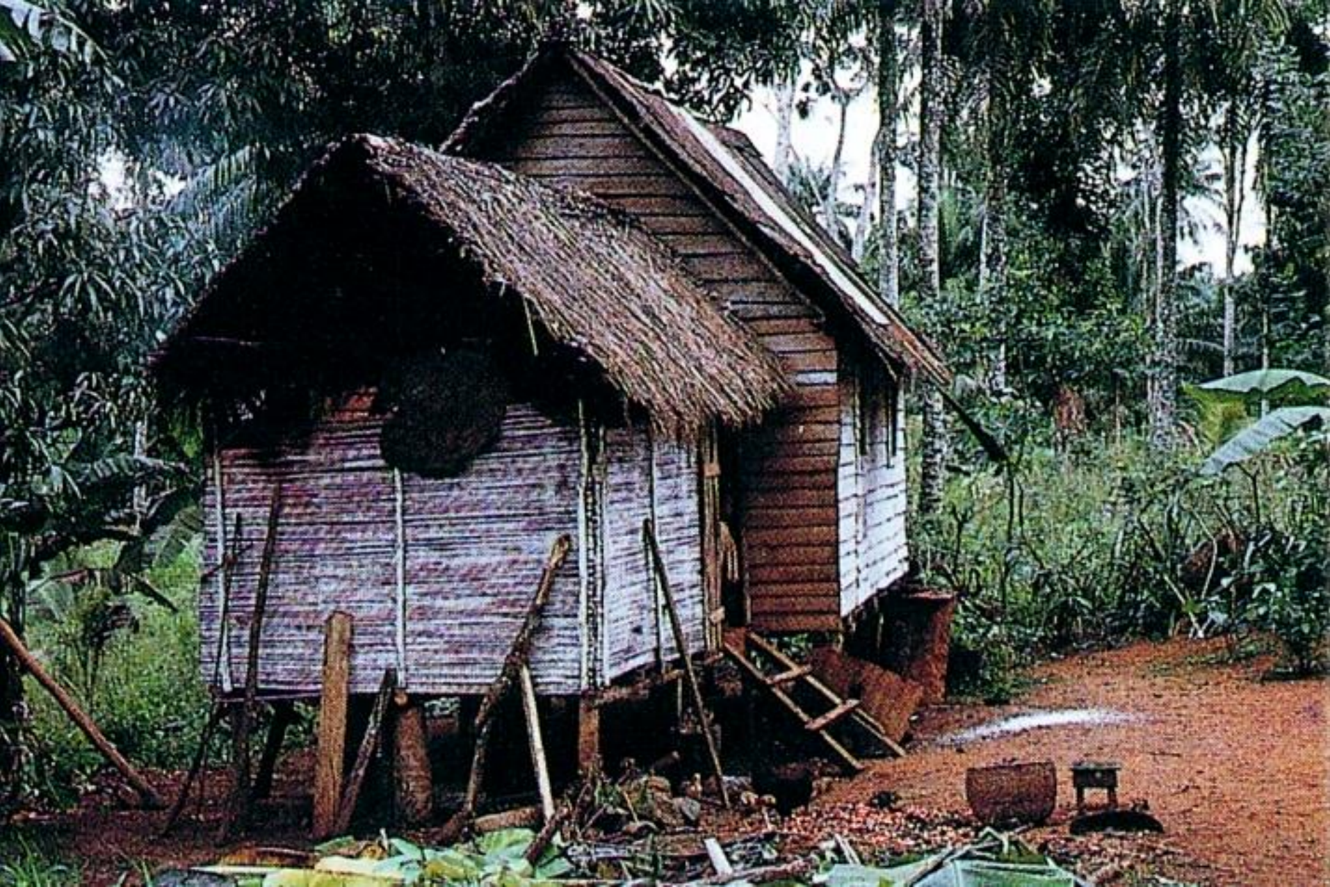
Cabanas de pescadores, São Tomé (1965)