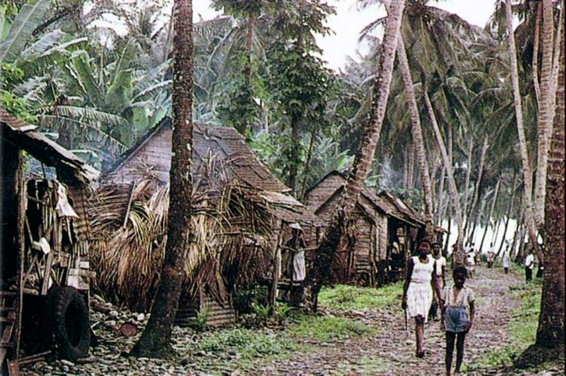
Cabanas de pescadores e palmares, São Tomé (1965)