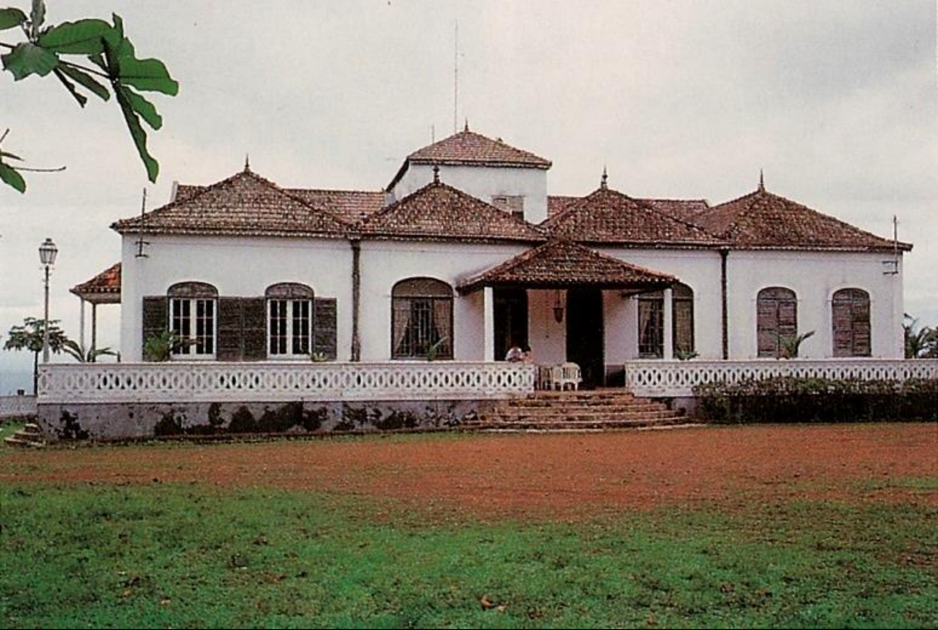
Príncipe, casa em estilo indiano (1965)