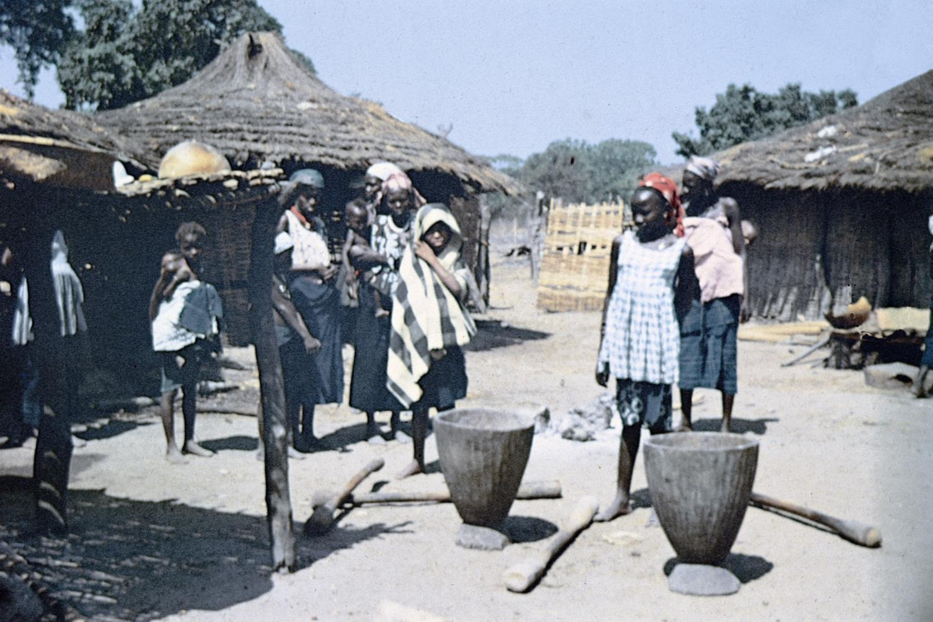
Mulheres mandingas preparam o almoço