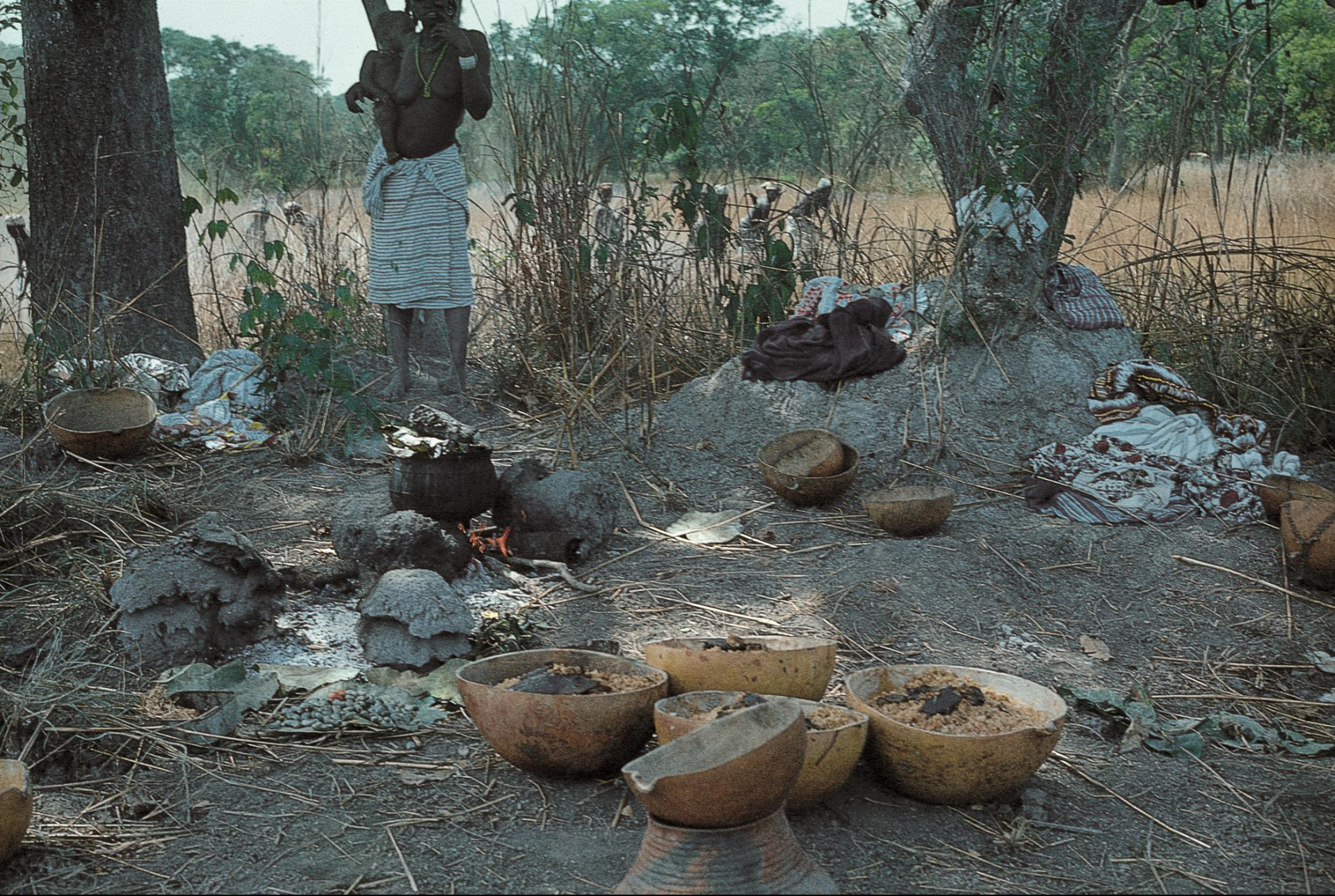
Perto de Bafatá : preparação de almoço comum...