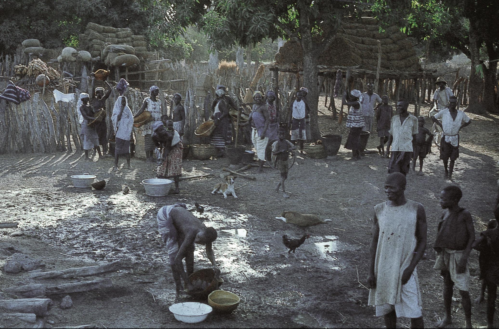
Preparando um almoço de festa numa tabanca do norte