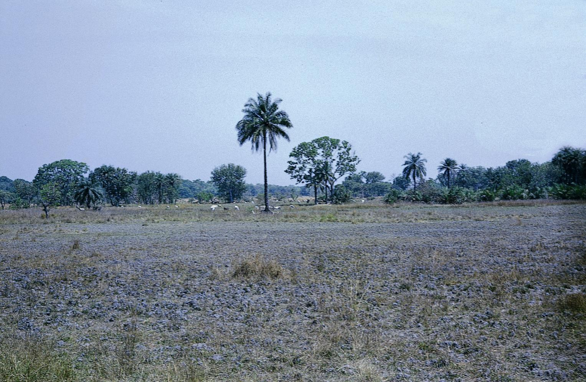
Pastagens pobres e grandes árvores, testemunhos de tabanca (aldeia)