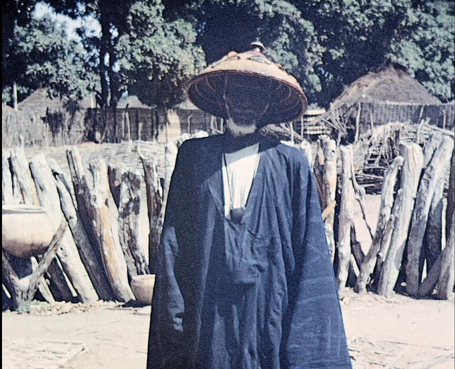
Chefe de aldeia fula