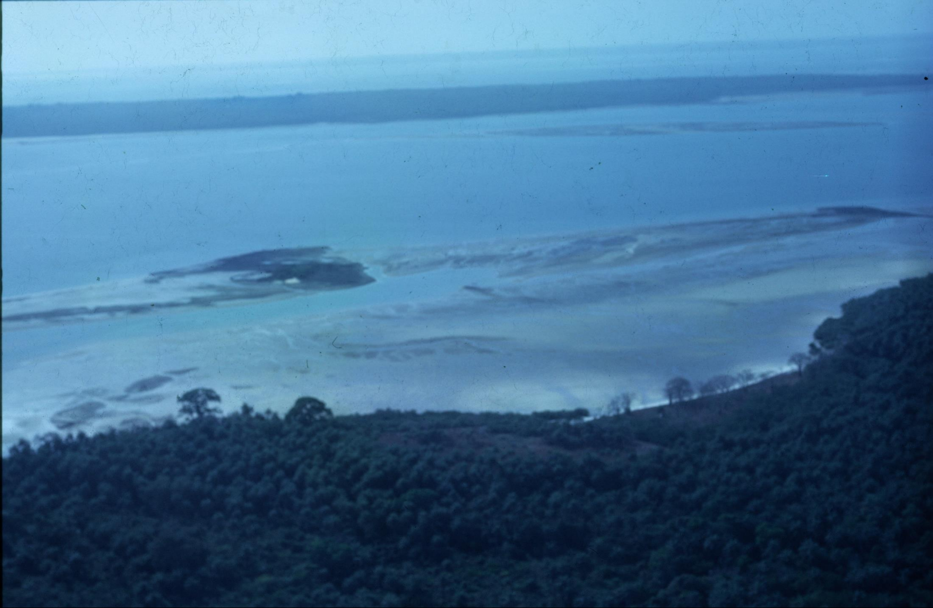
Arquipélago de Bijagós – vista parcial