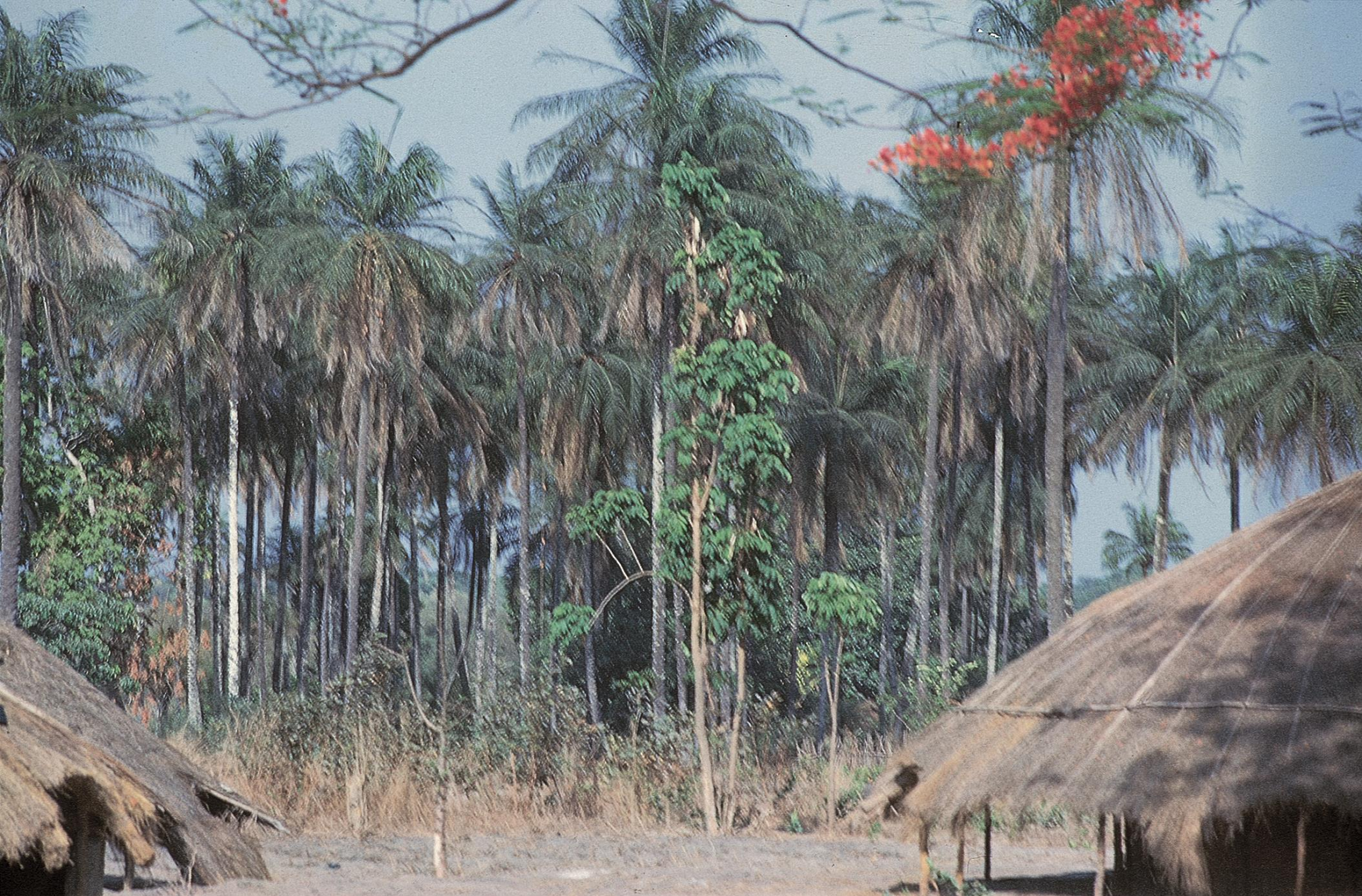
Mato e palmar numa velha aldeia do Sul