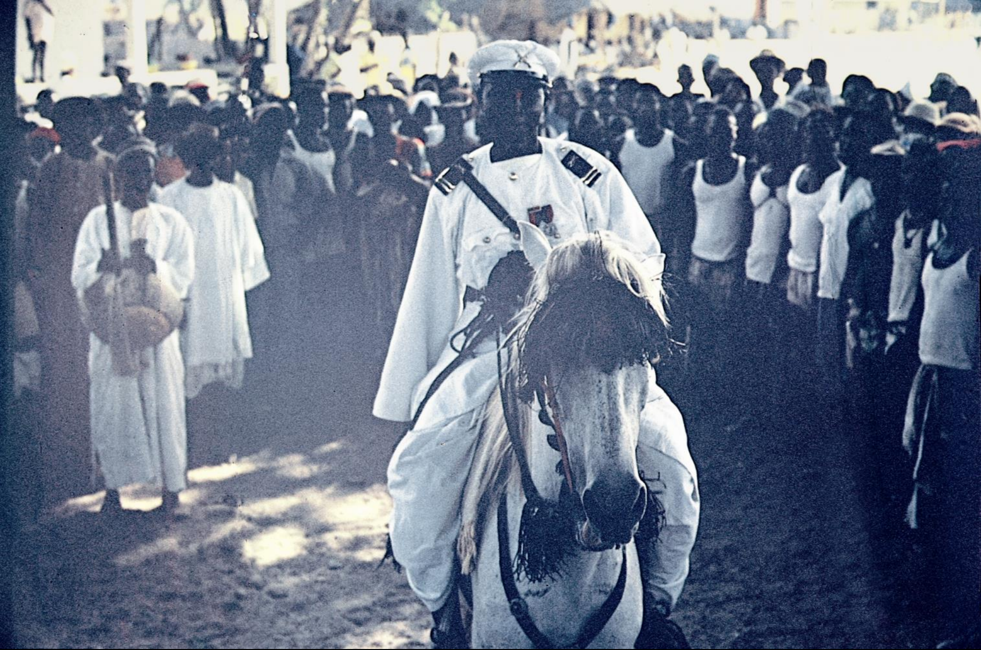
Guerreiro fula , com dignidade militar portuguesa