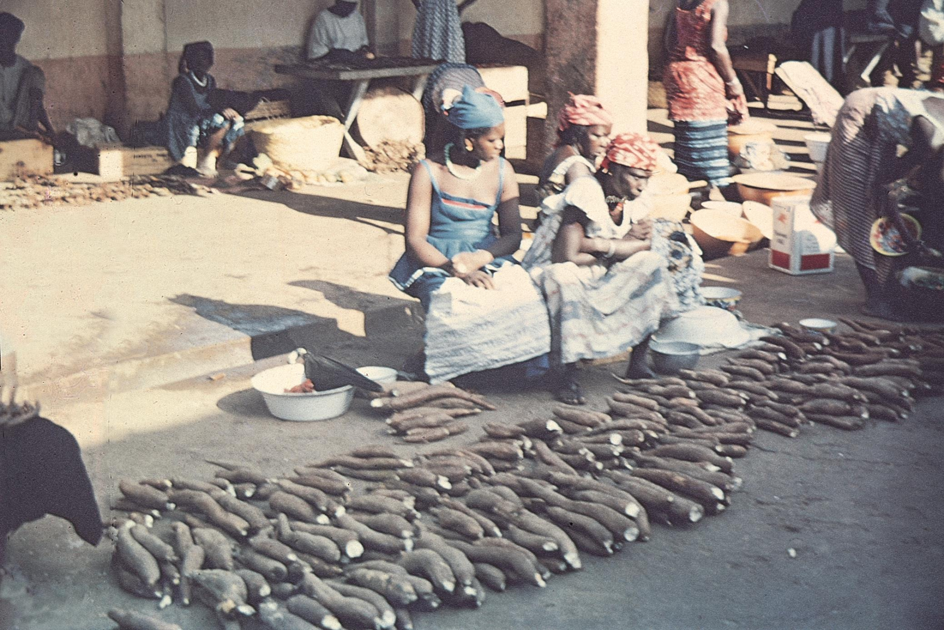
Venda de mandioca, no mercado de Bissau