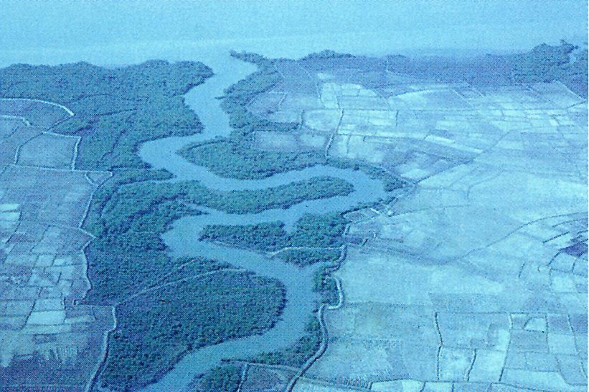
Rio Mansôa meandrisando entre mangal