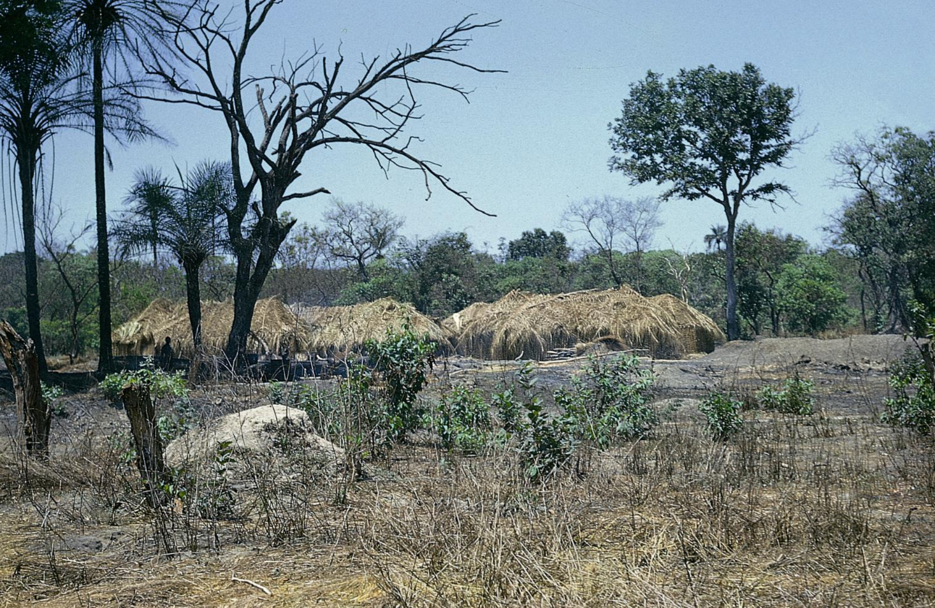
Tabanca fula , prestes a ser mudada, por esgotamento do terreno