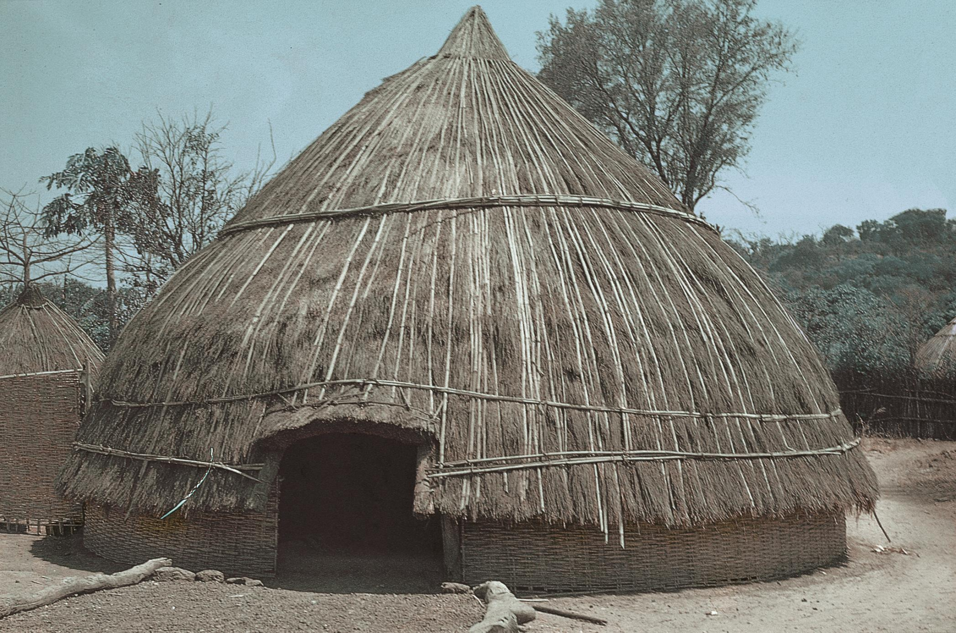
Gabú: casa mandinga