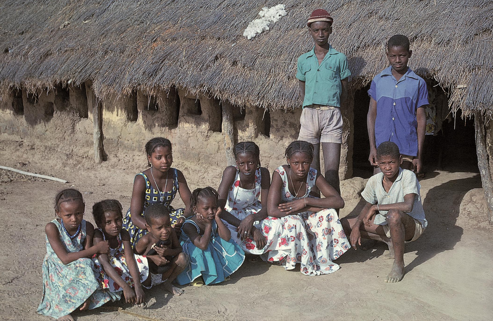
Jovens e crianças fulas à entrada de uma casa perto de Mansôa