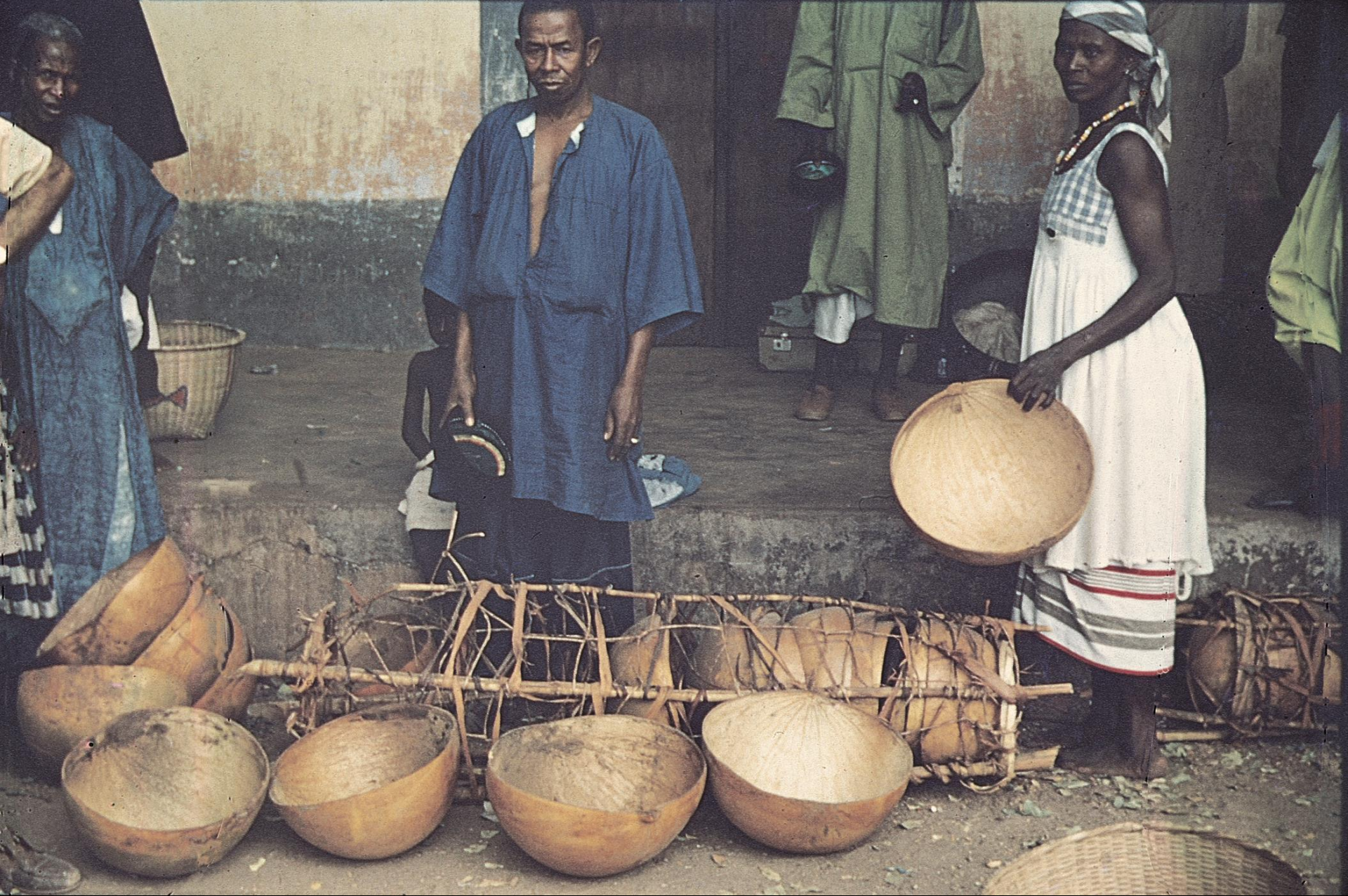
Venda de cabaças, no mercado de Bissau