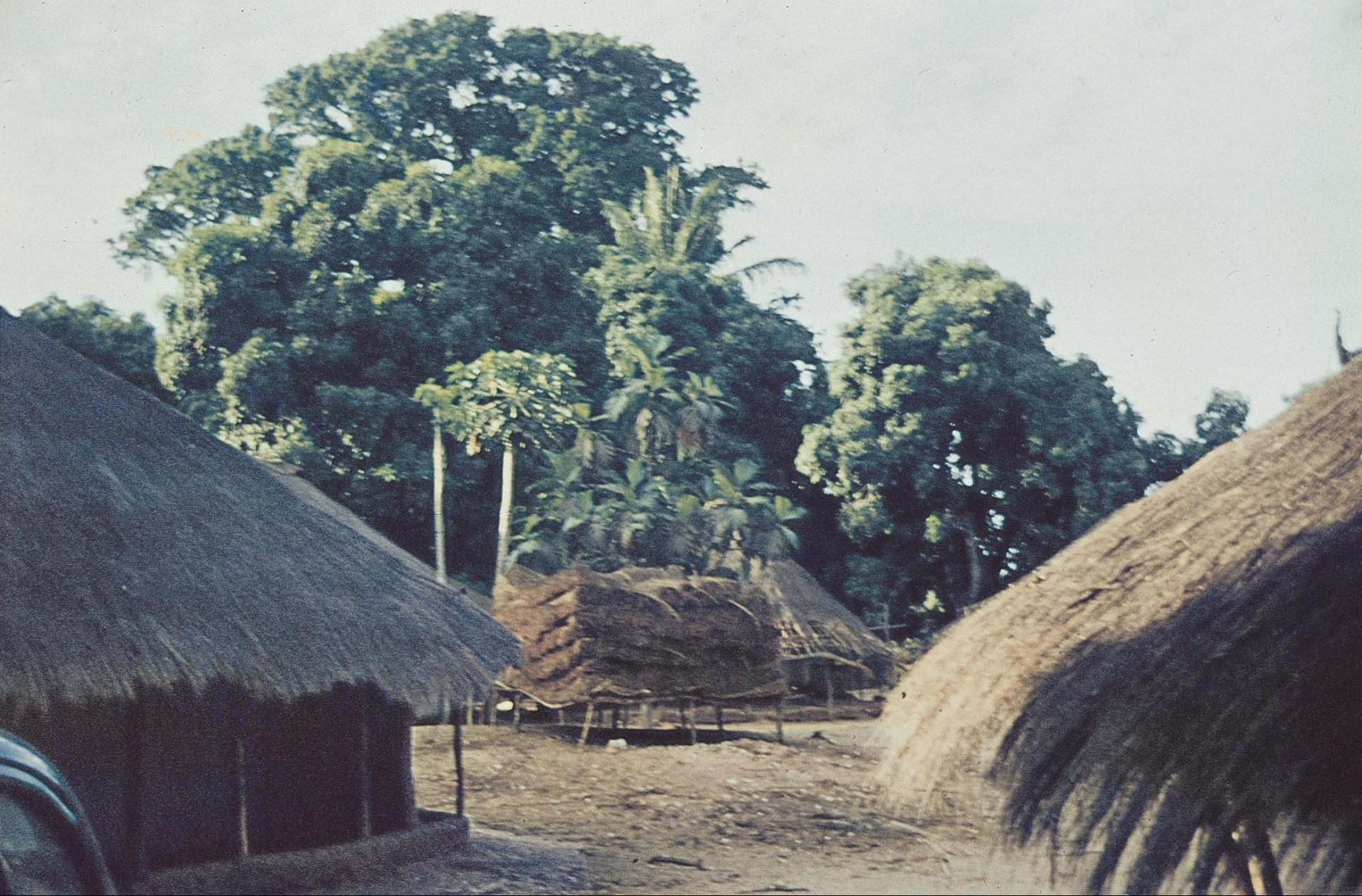
Aldeia bijagós , rodeada por frondosas árvores de fruto