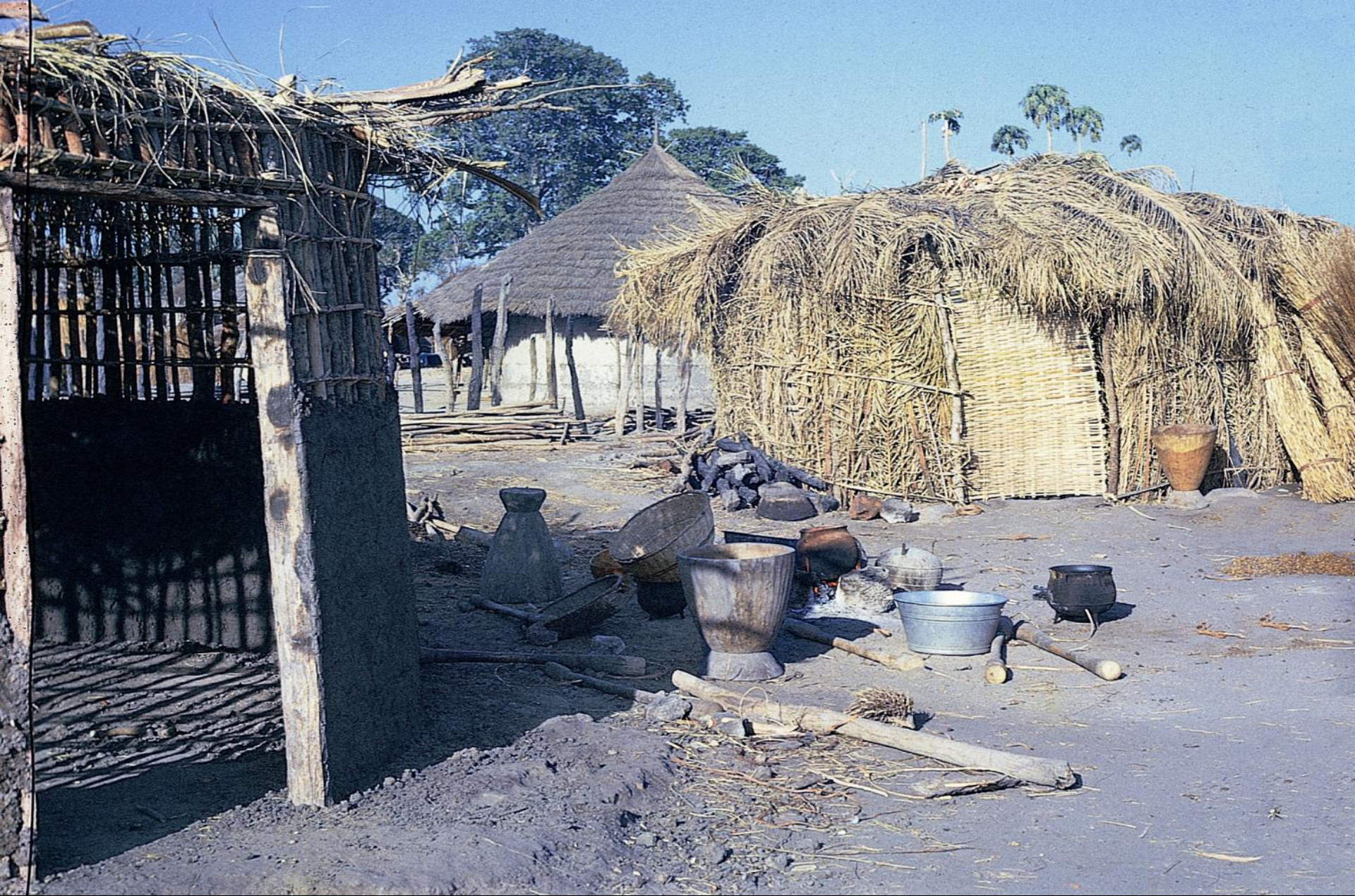
“Cozinha” numa tabanca fula