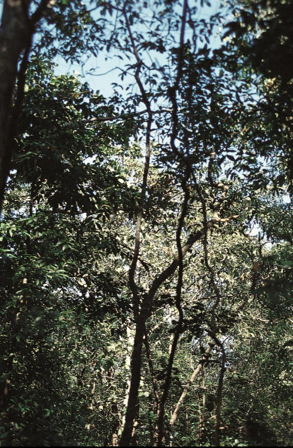
Sanguém – floresta secundária (1956)