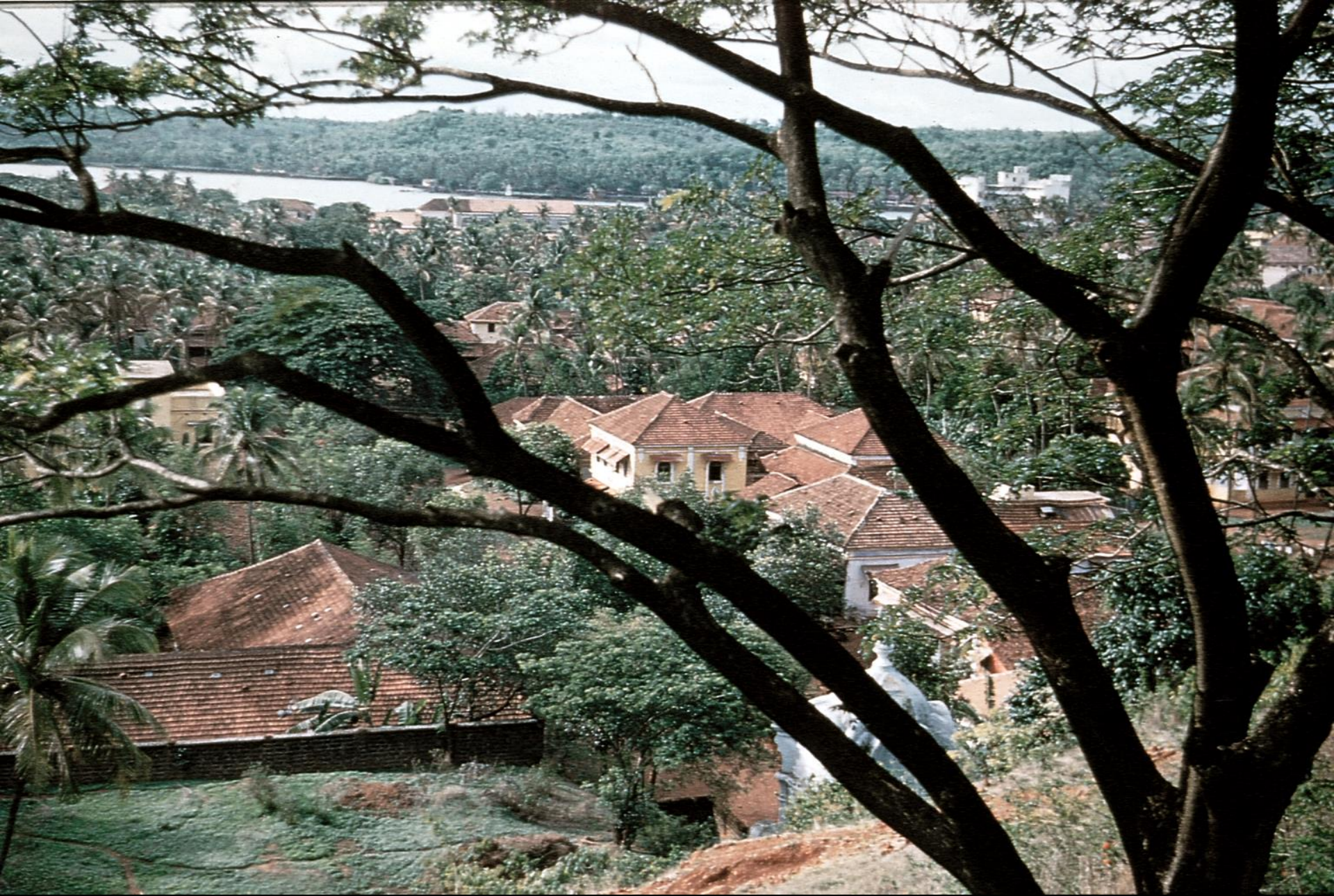
Pangim – vista parcial, tirada do Altinho (1956)