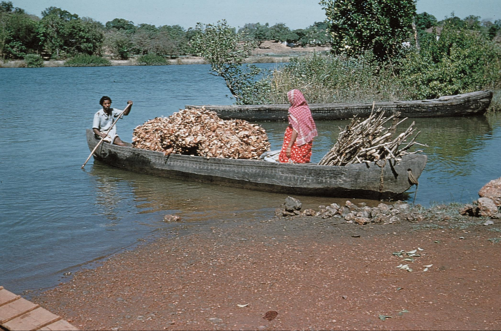
Ilhas – transporte de produtos para o mercado (1956)