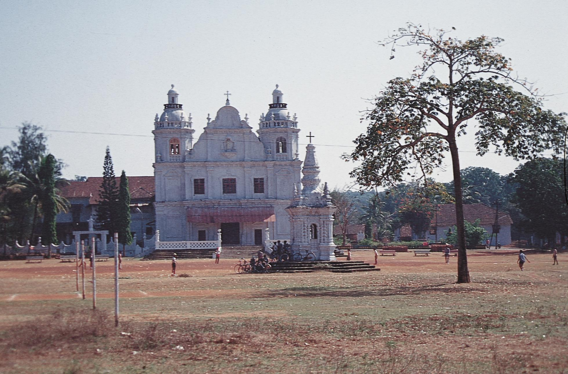
Uma das mais belas Igreja de Goa (1956)