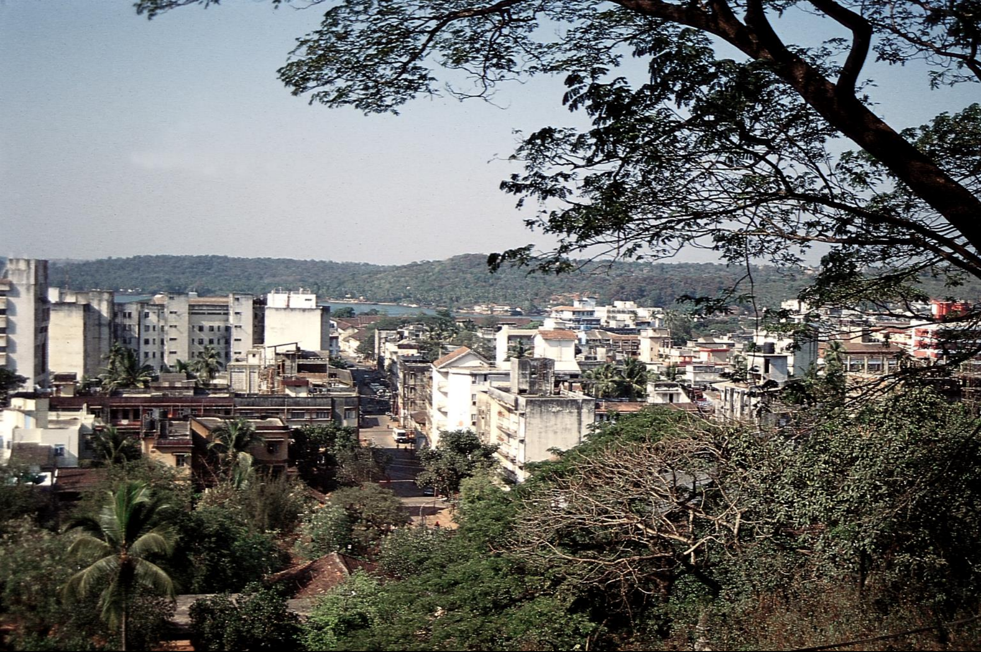
Pangim – outra vista parcial, tirada do Altinho (1995)