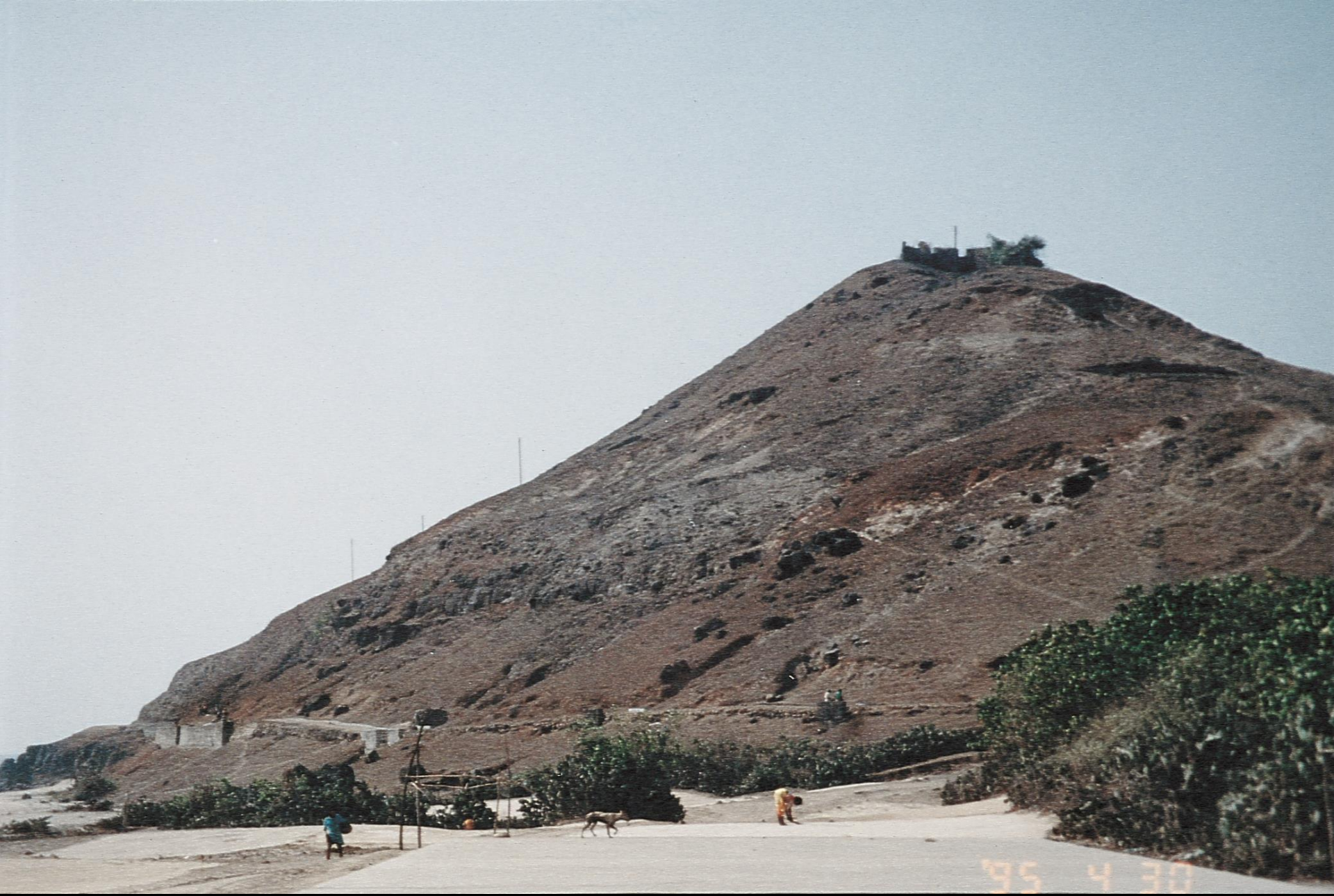
Colina e Fortaleza de Tiracol (1995)