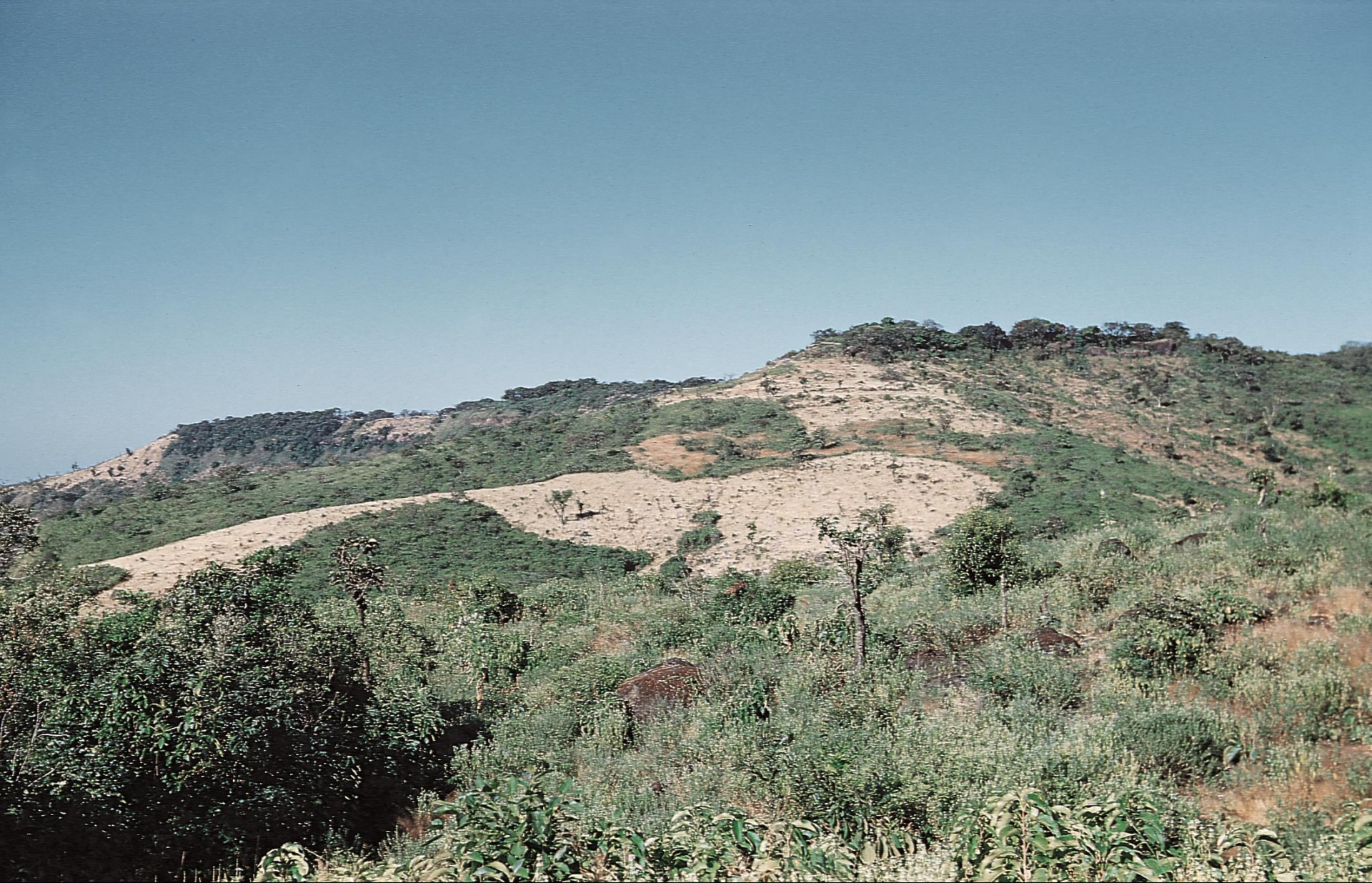
Bicholim – pequeno planalto de laterite com cumerins prontos para cultivar (1956)