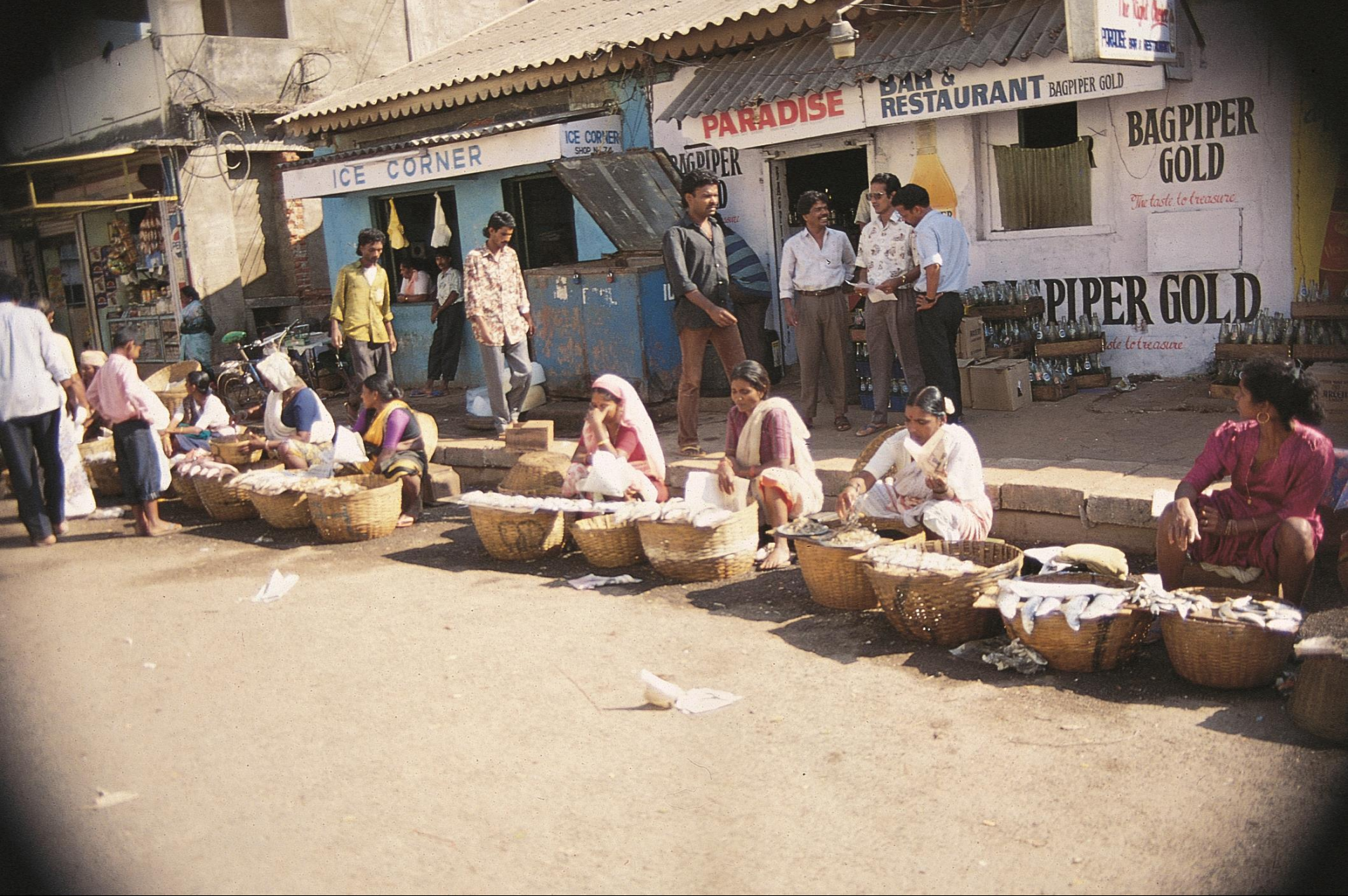
Satari – mercado do peixe seco em Sanquelim (1955)