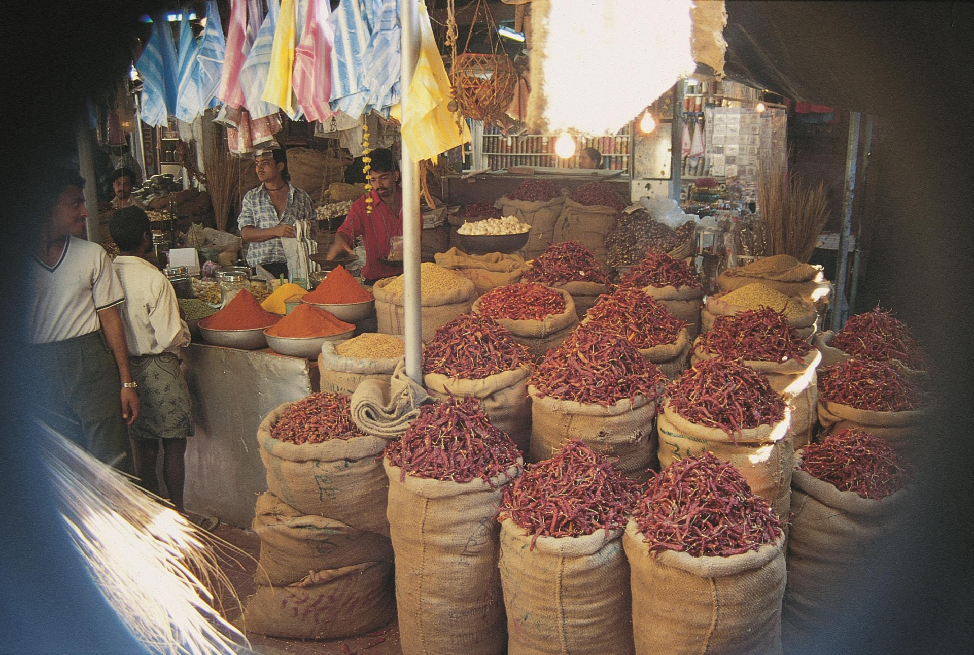
Mercado de Margão – área de especiarias (1956)