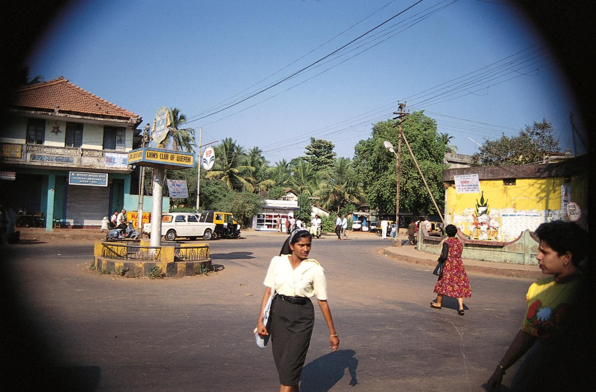
Margão – um largo da cidade (1956)