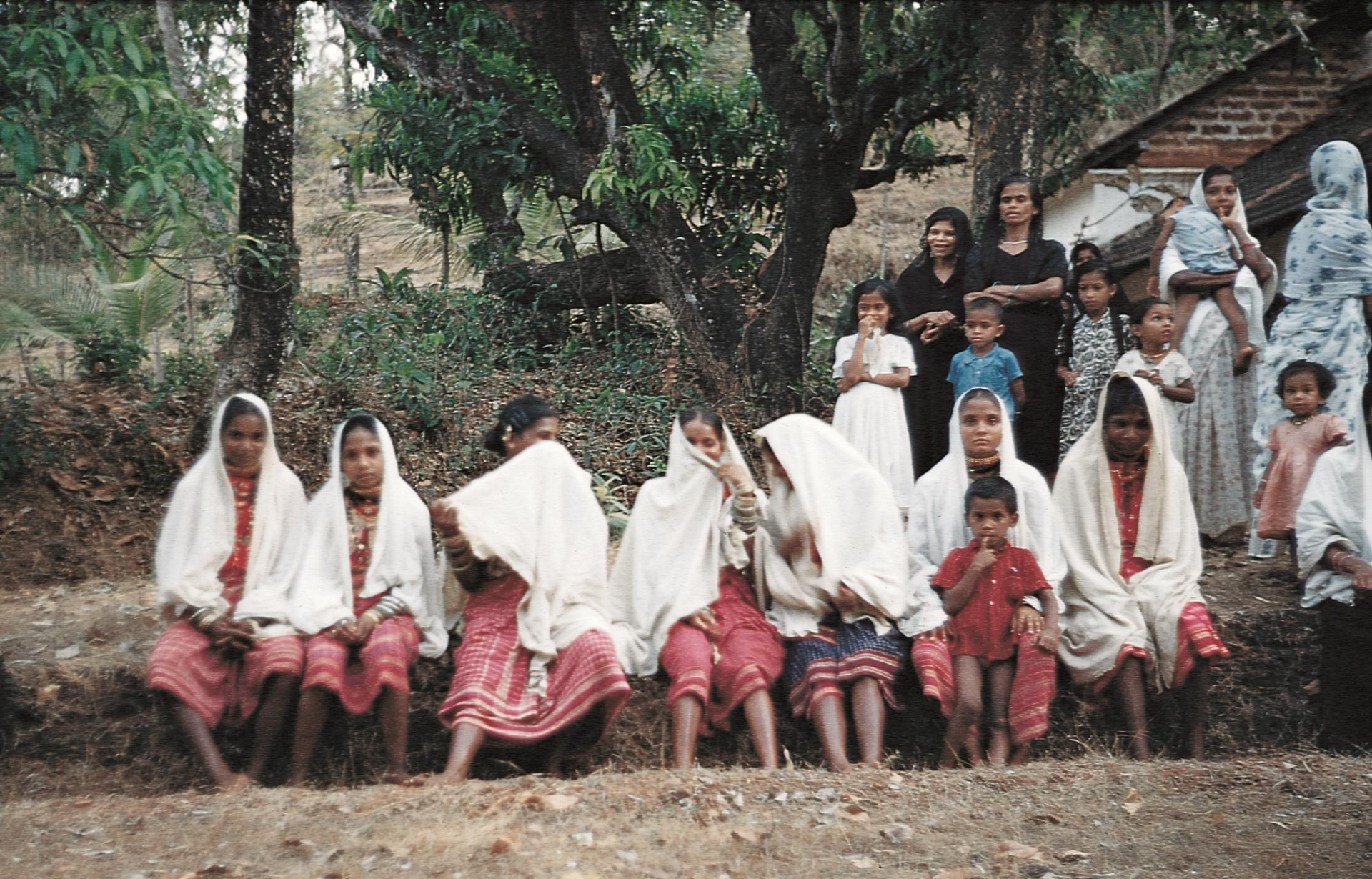
Sanguém – grupo de trabalhadoras de campo ( corumbinas ), com seus trajes típicos (1955)