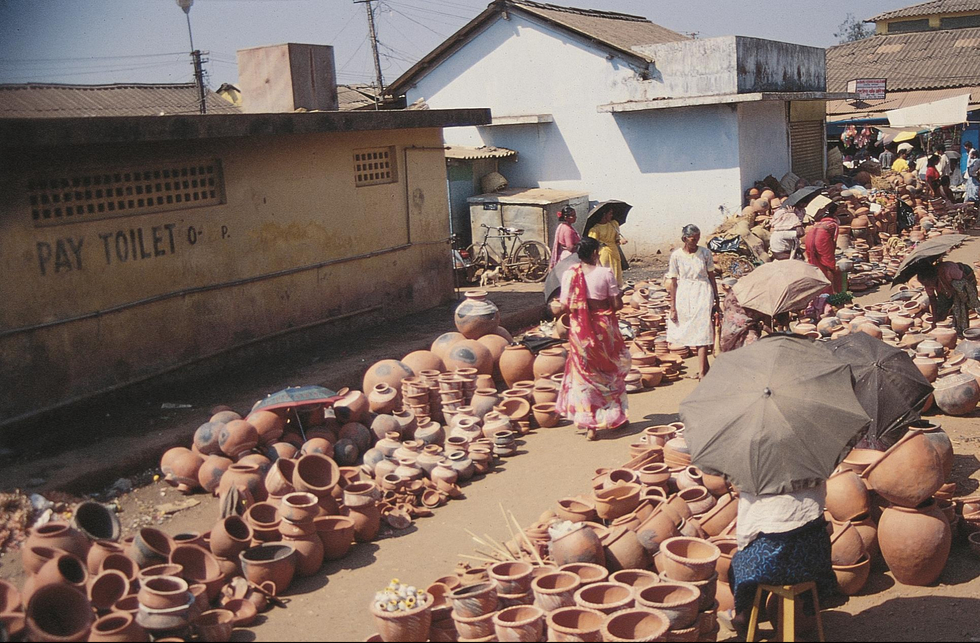
Mercado de Mapuçá – olaria (1995)