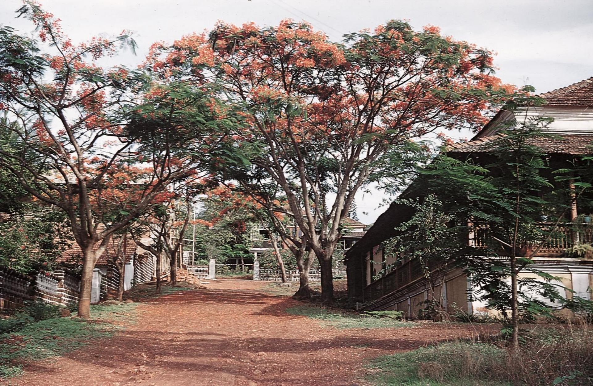
Pangim – Altimho, bonita casa luso-indiana e belas acácias (1956)