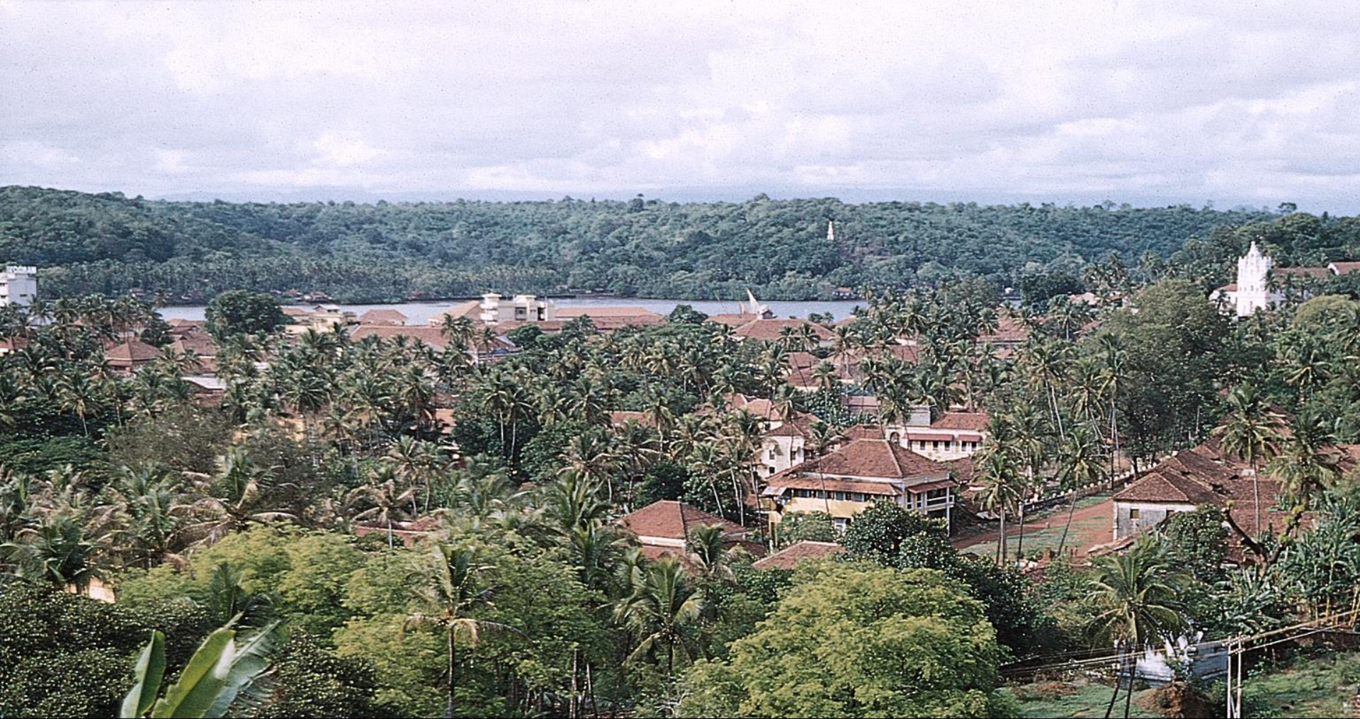
Pangim – vista geral da cidade (1956)