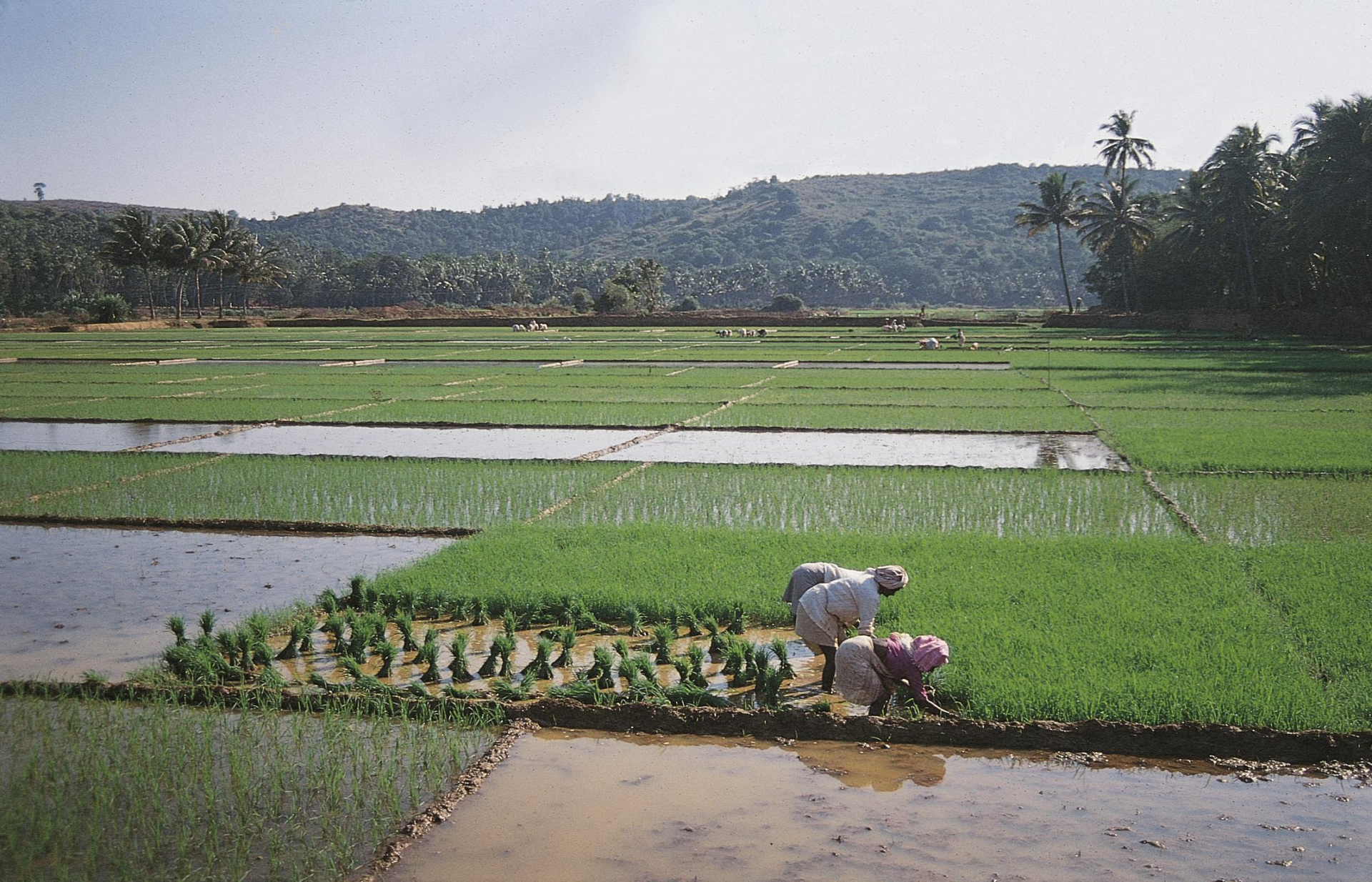
Pondá – repicando arroz de um viveiro para plantação definitiva