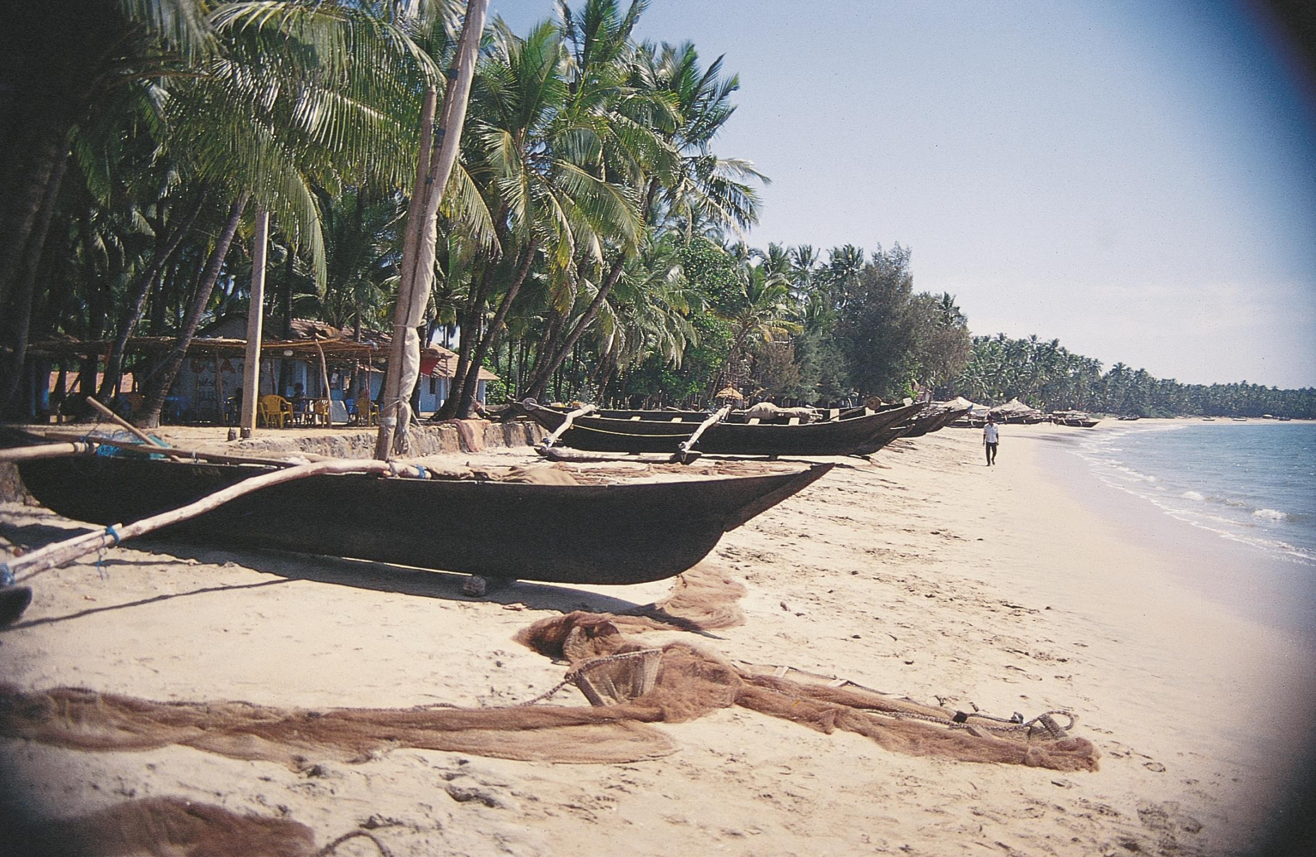
Bardez - praia de Calangute e seu extenso coqueiral (1994)