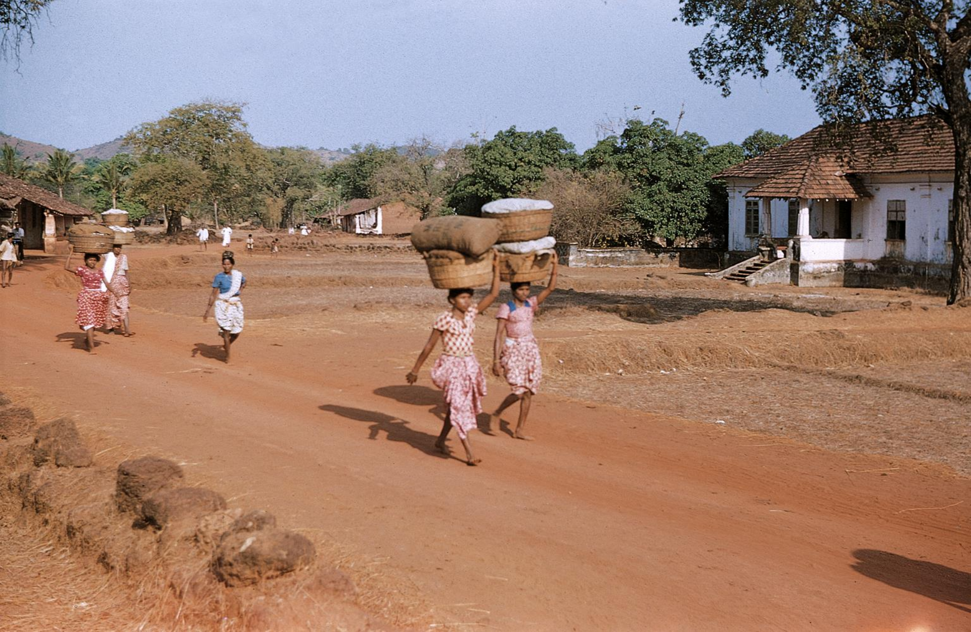
Salcete – em Curtorim, a caminho do mercado de Margão (1956)