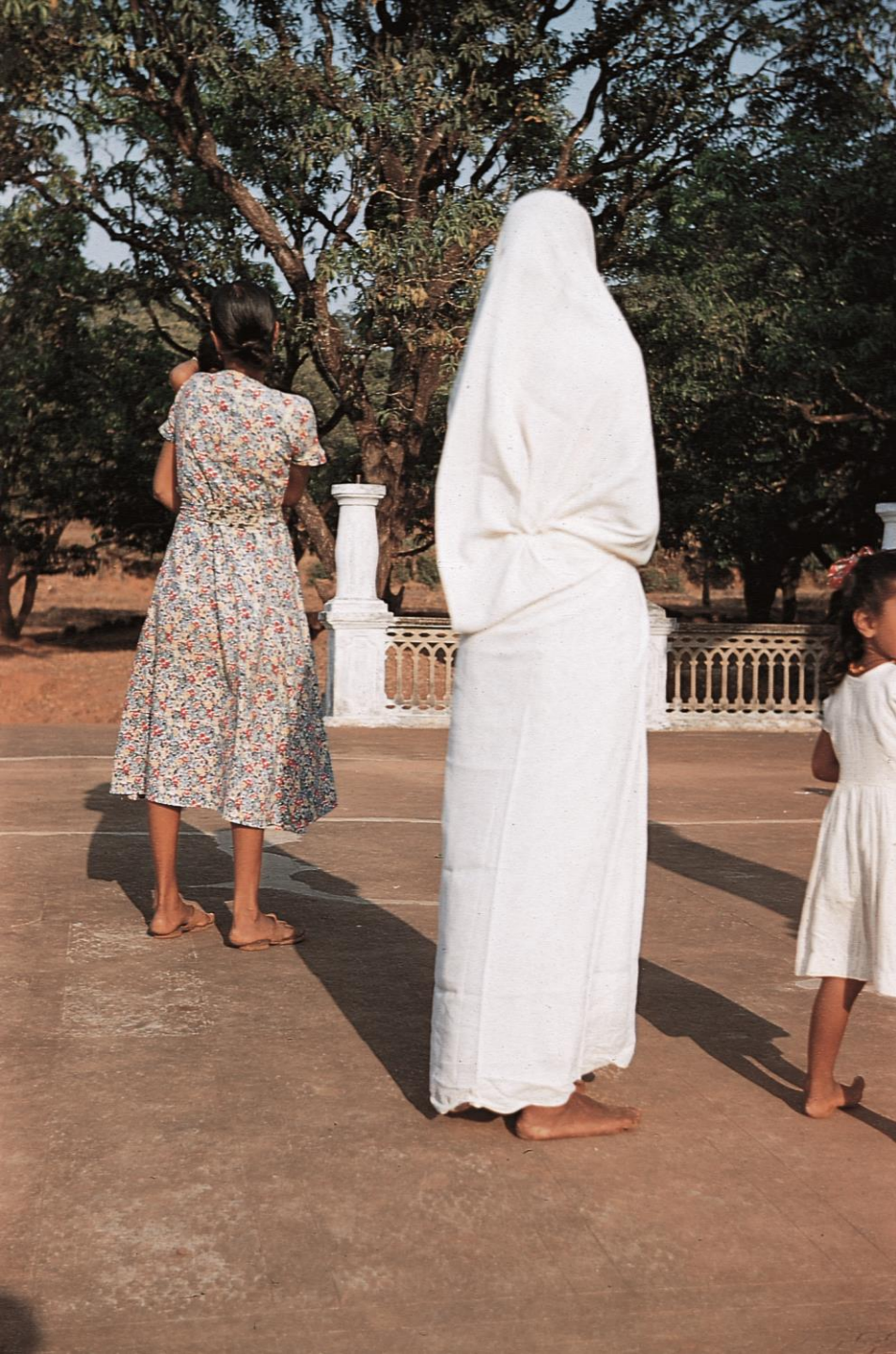
Sanguém – mulher cristã com veste tradicional de festa ( pano bajú ) (1956)