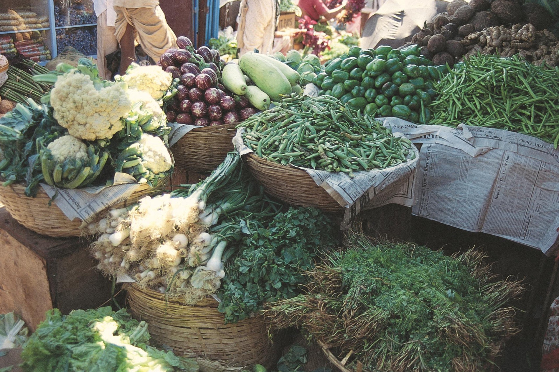
Mercado de Mapuçá – área de verduras (1994)