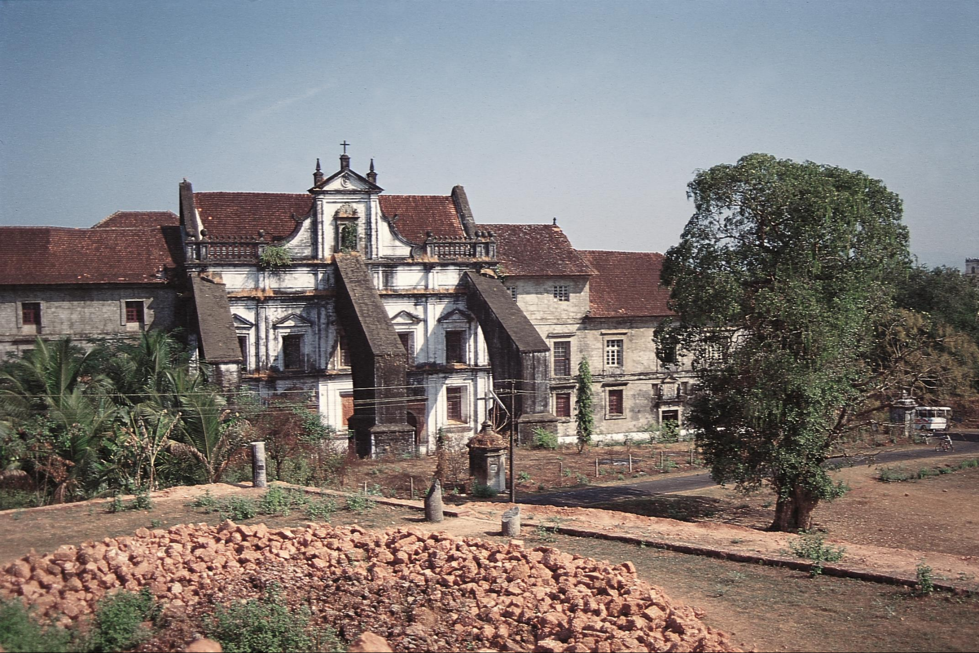
Velha Goa – Igreja de Santa Mónica (1956)