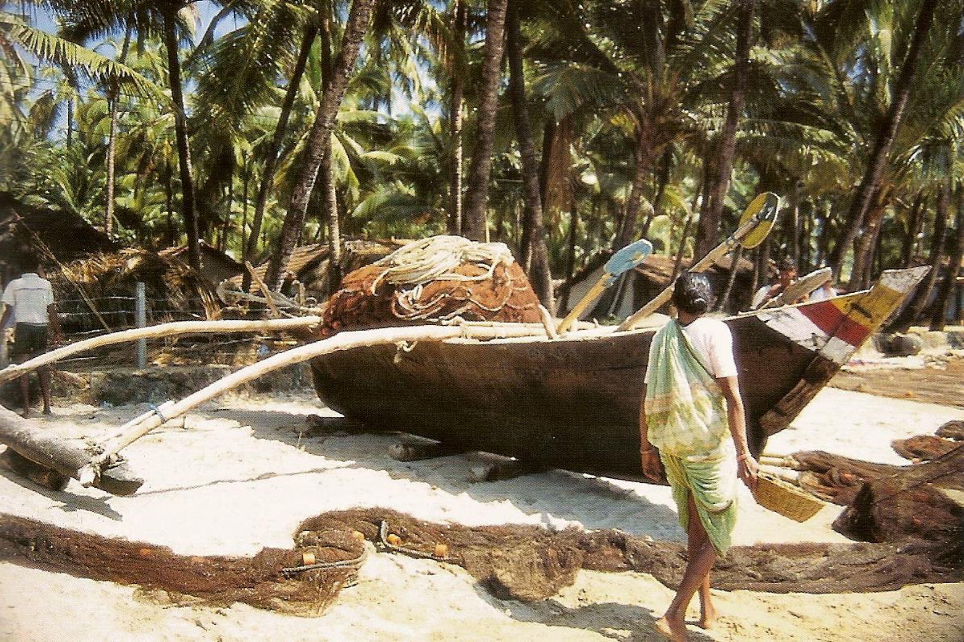
Canácona – barco preparado para a pesca, em Palolém