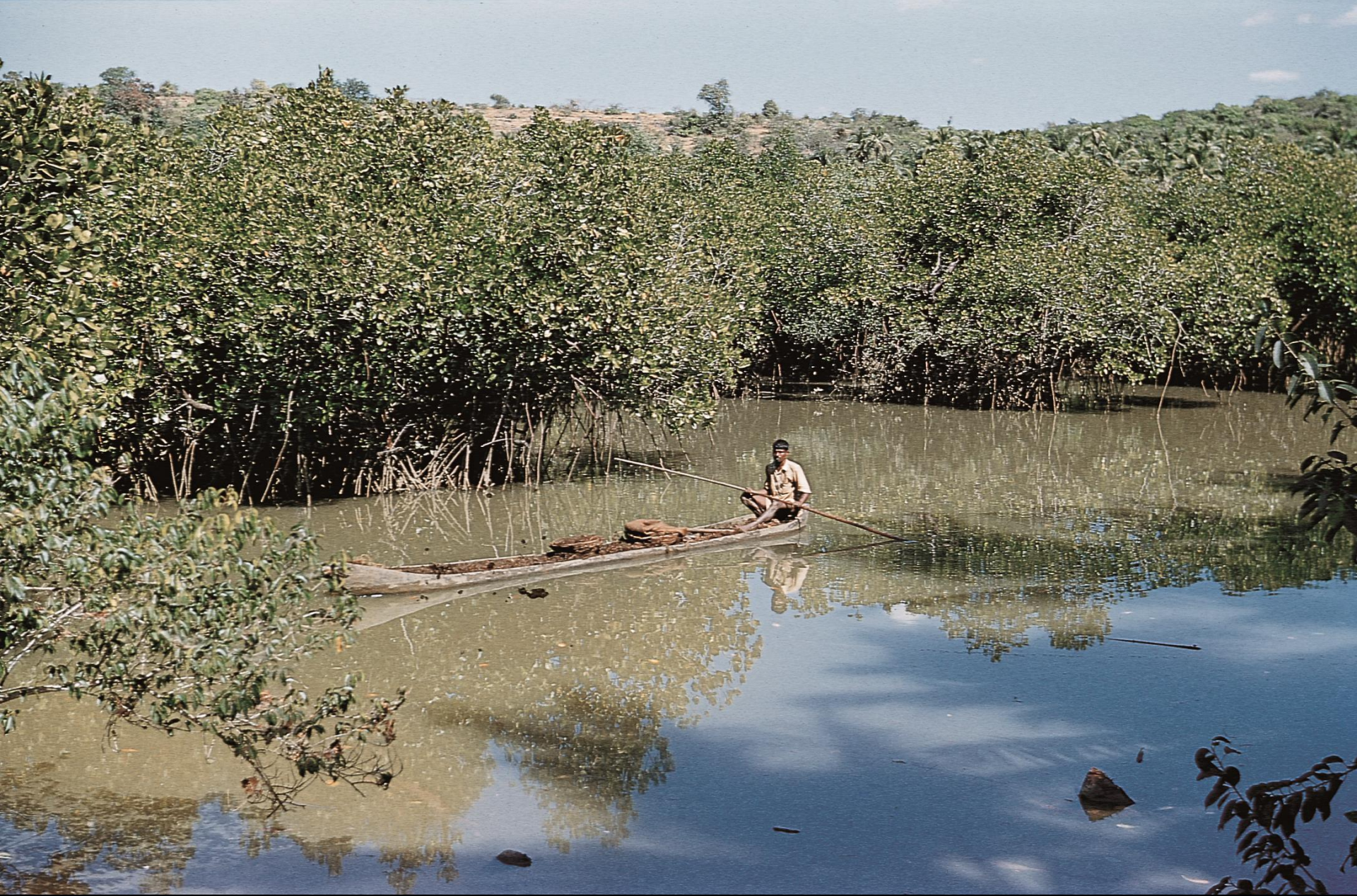
Ilha de Goa – rio e mangal (1955)