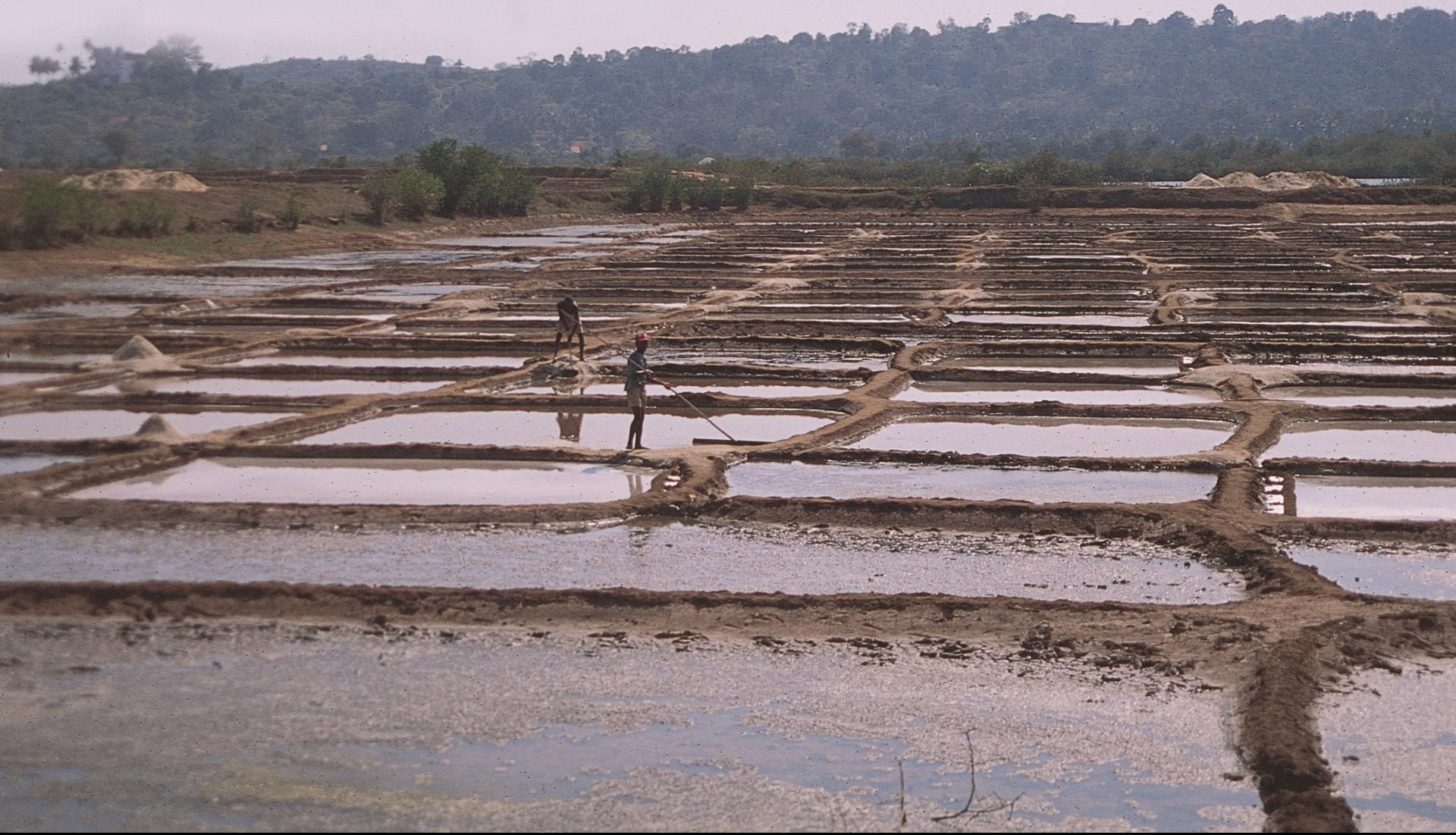
Ilhas, Santa Cruz – salinas (1996)