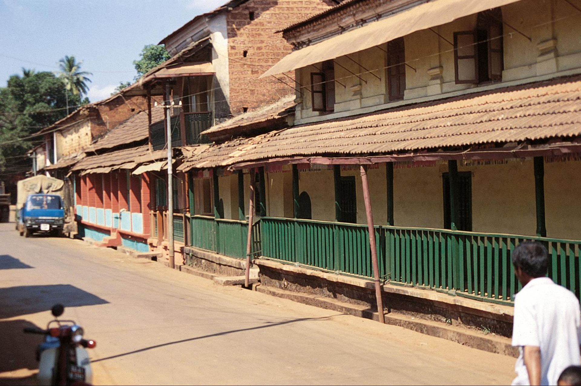
Satari – uma rua de Sanquelim (1955)