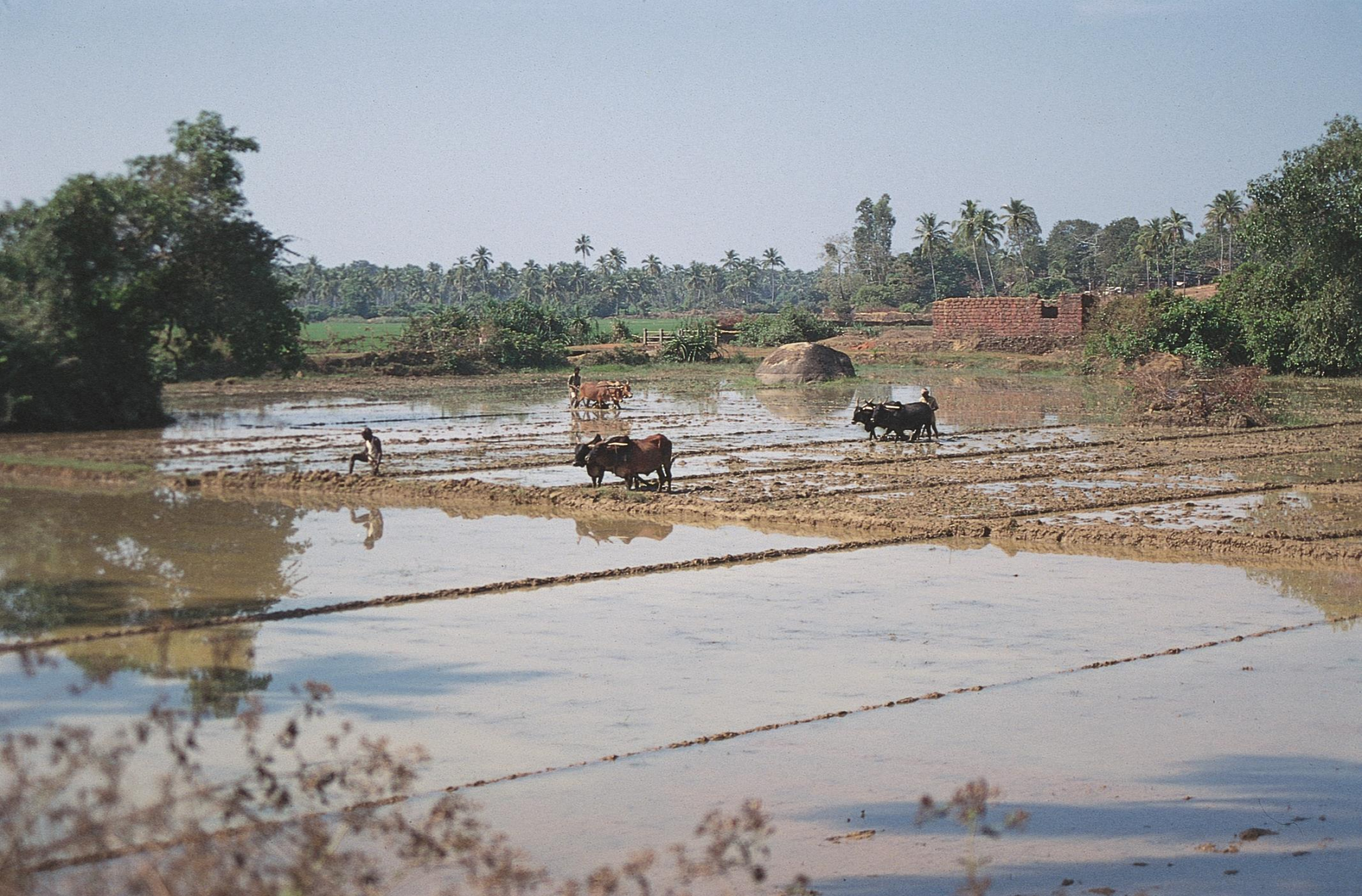
Salcete – fazendo lama para repicar arroz