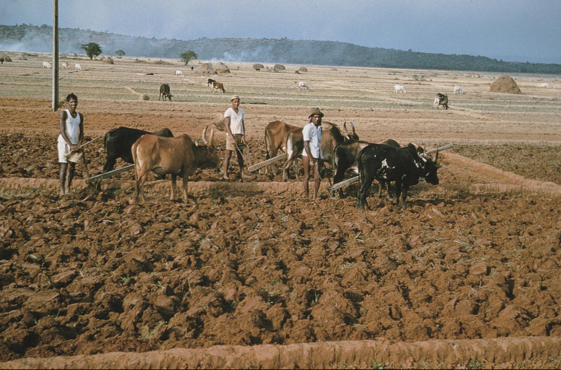
Bardez – lavrando várzeas para arroz