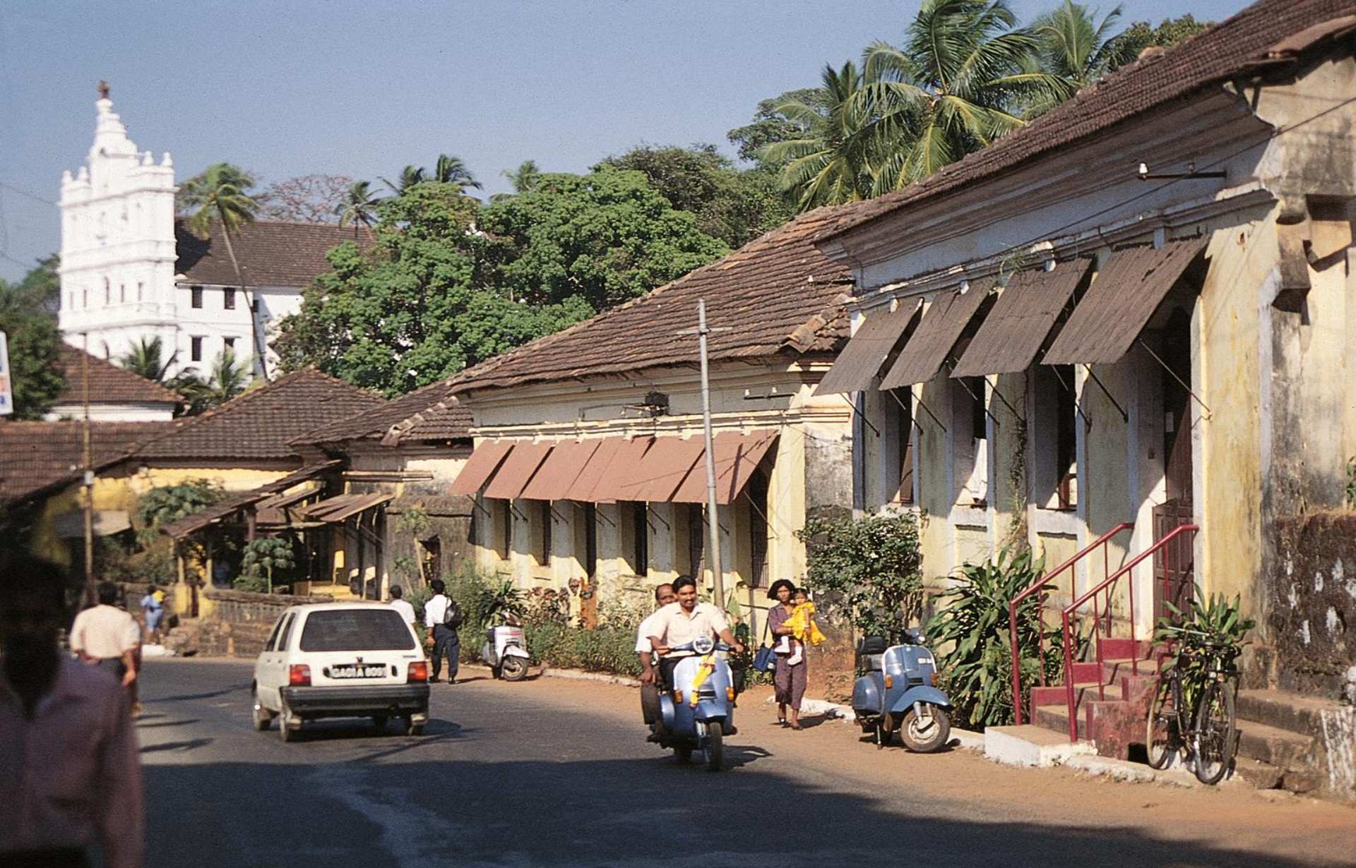
Margão – casas tradicionais com janelas protegidas contra a chuva (1955)