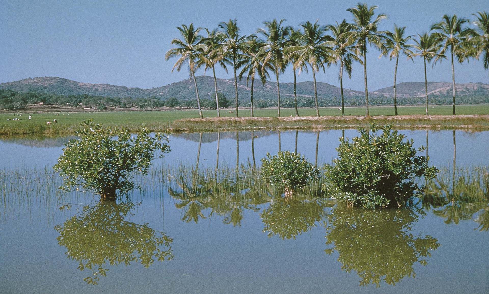
Bardez – rio, coqueiros e várzeas, paisagem comum mantida no litoral (1956)