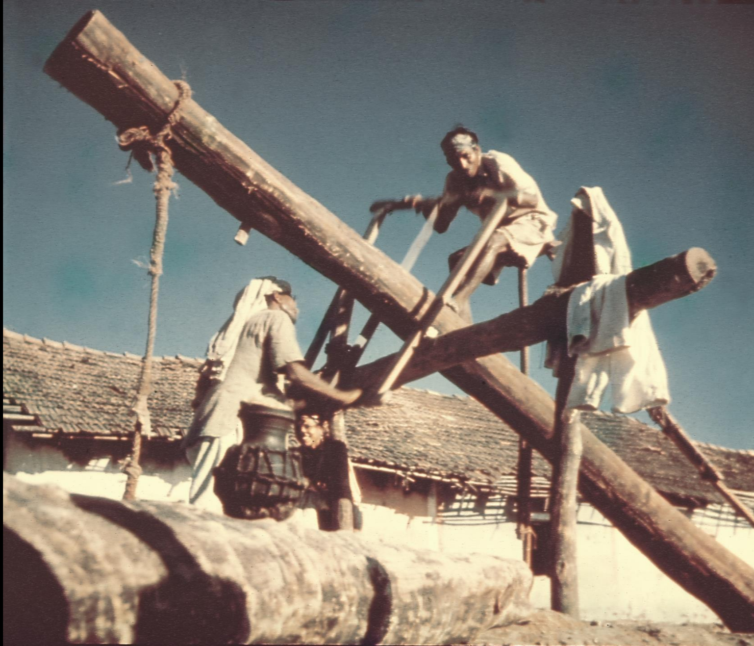
Preparando madeira para os barcos (1956)