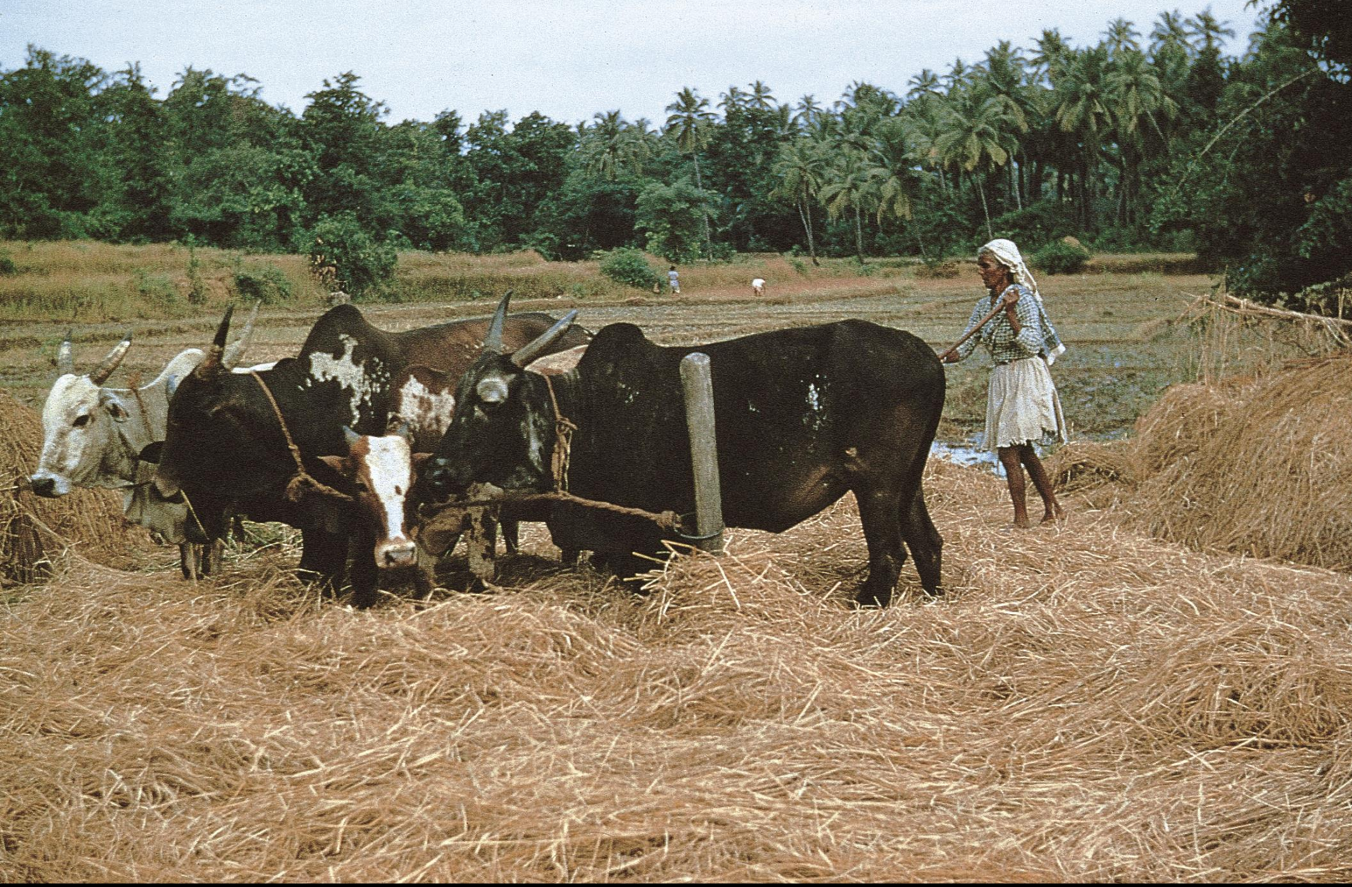
Salcete – outra técnica de debulha de arroz (1955)