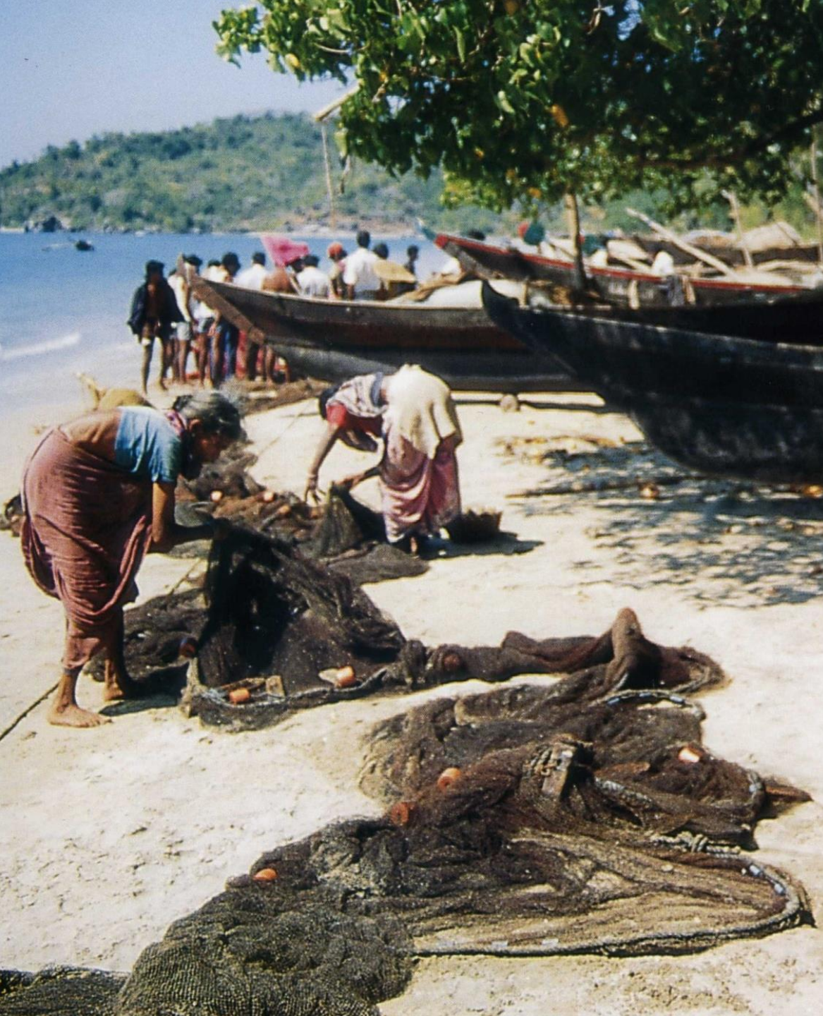
Salcete, Colvá – limpando as redes