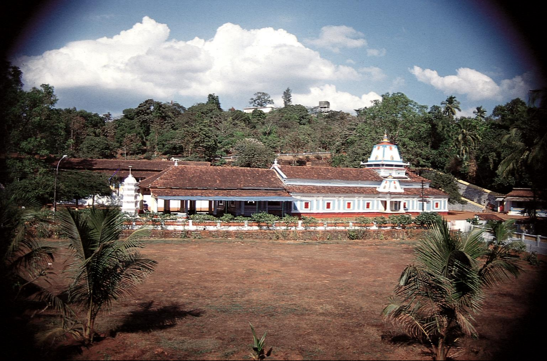
Satari – Templo principal de Sanquelim (1955)