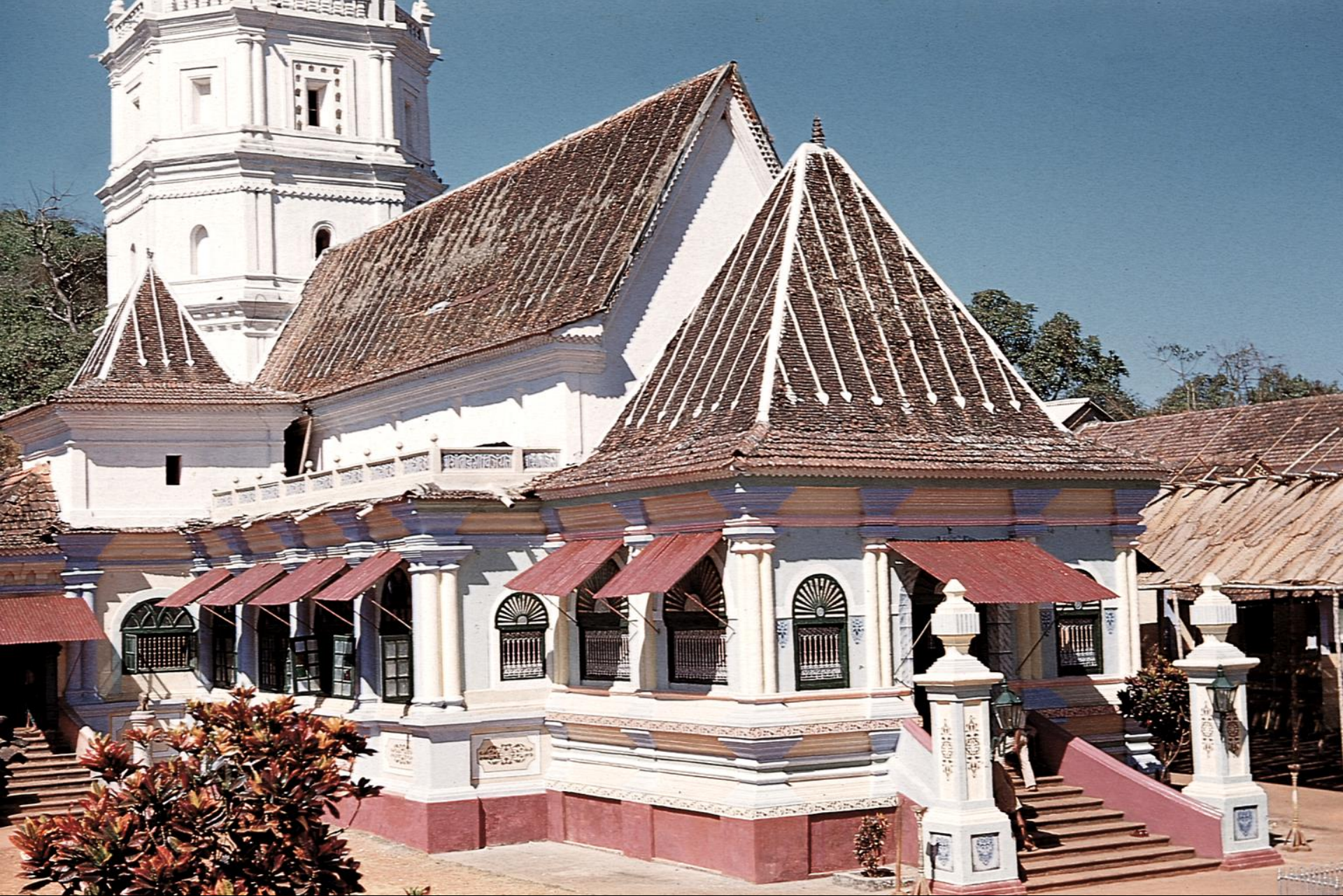
Pondá – Templo de Mangueixa (1956)