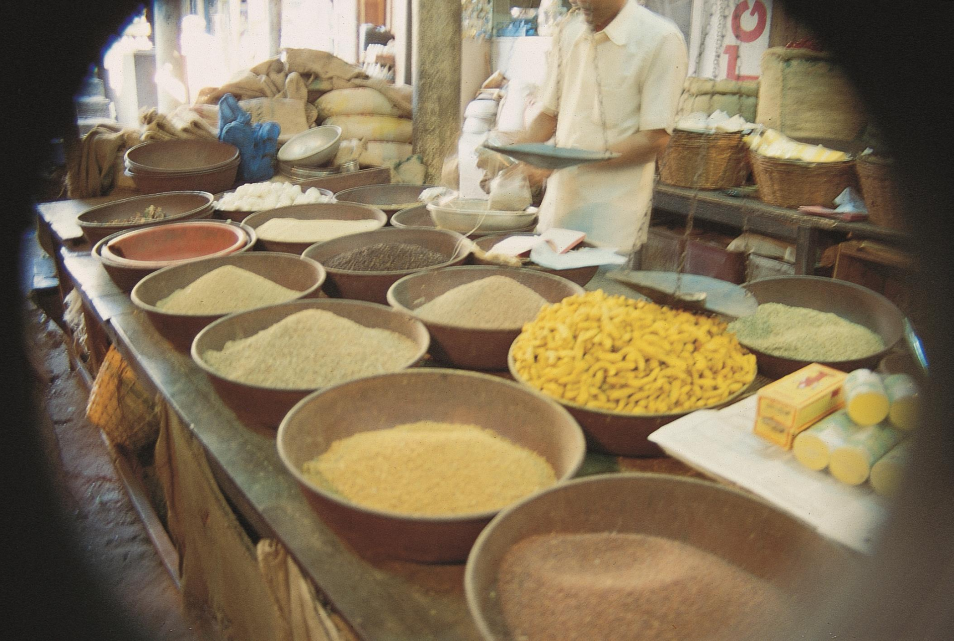
Mercado de Margão – outra área de especiarias (1995)