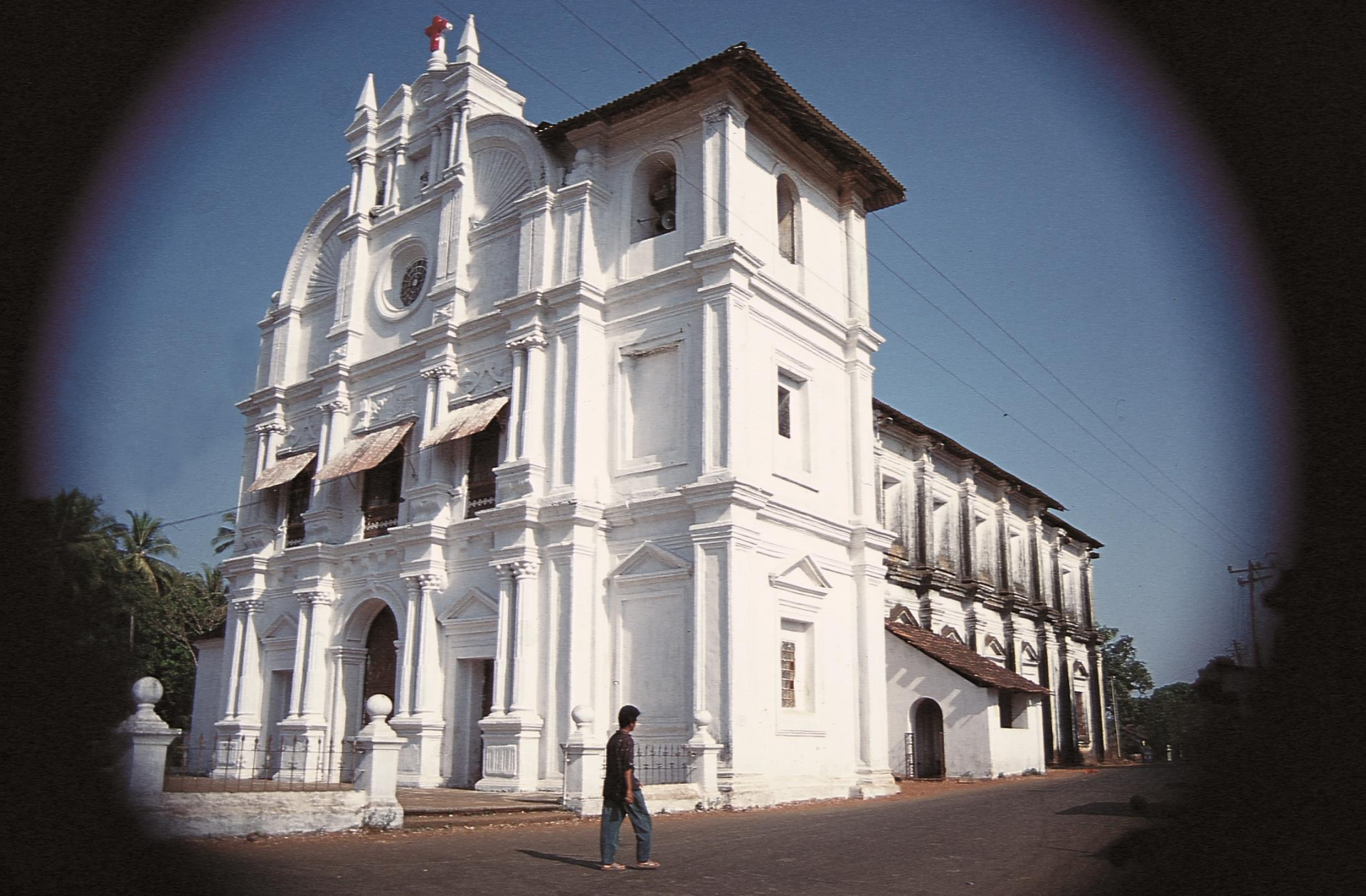
Velha Goa – Sé (1994)