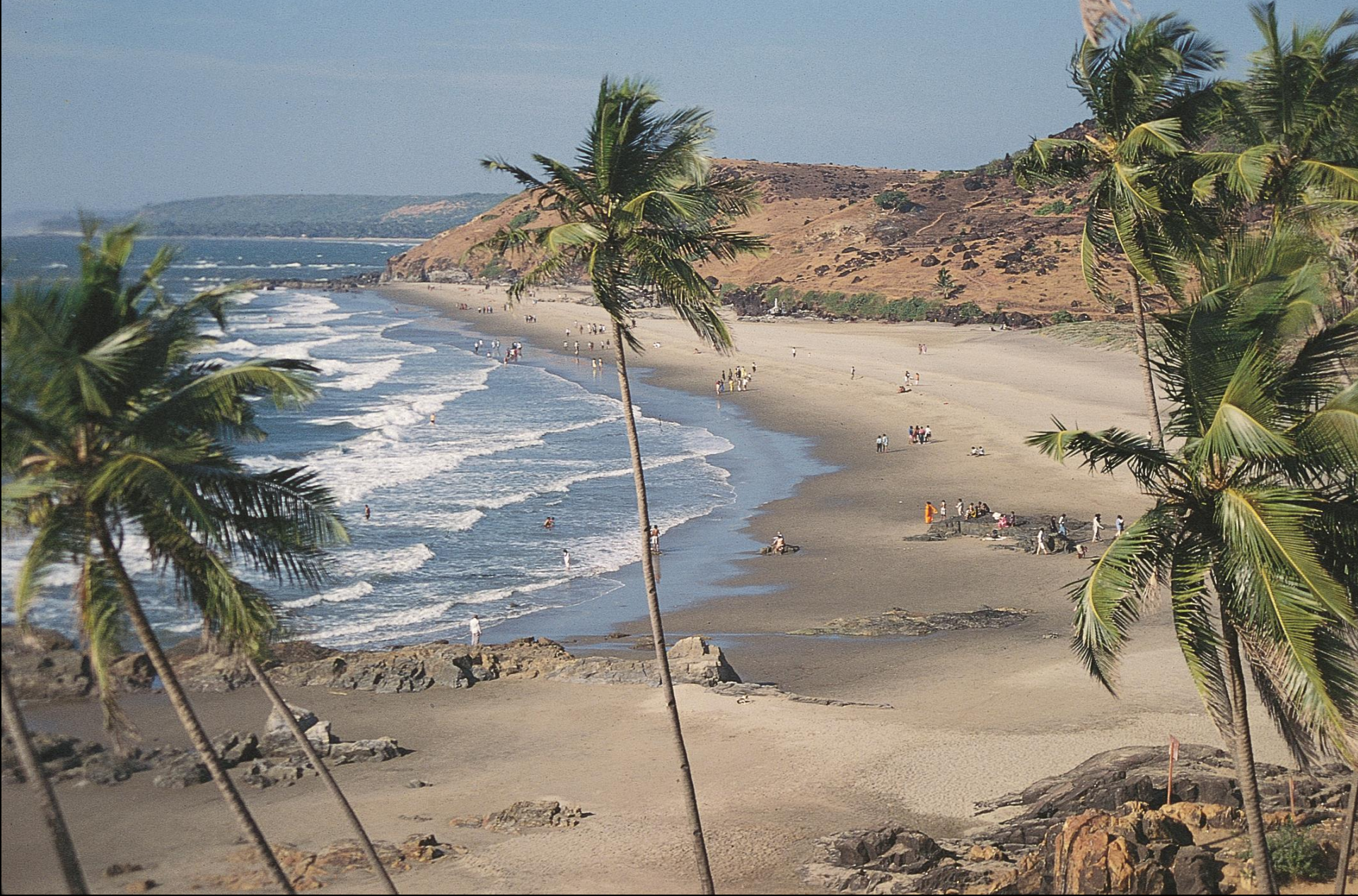
Bardez - praia de Vagator (1995)