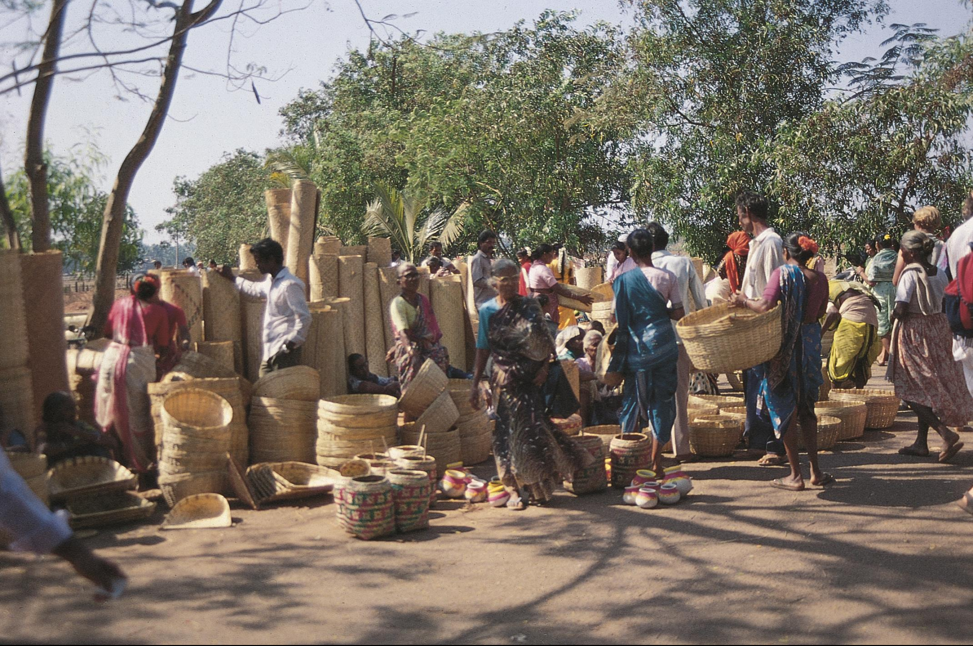
Mercado de Mapuçá – cestaria (1955)