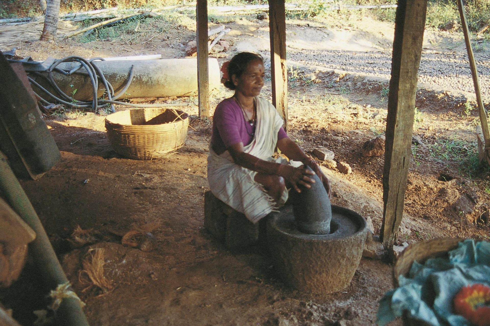
Satari – moendo arroz numa casa grande em Birondém