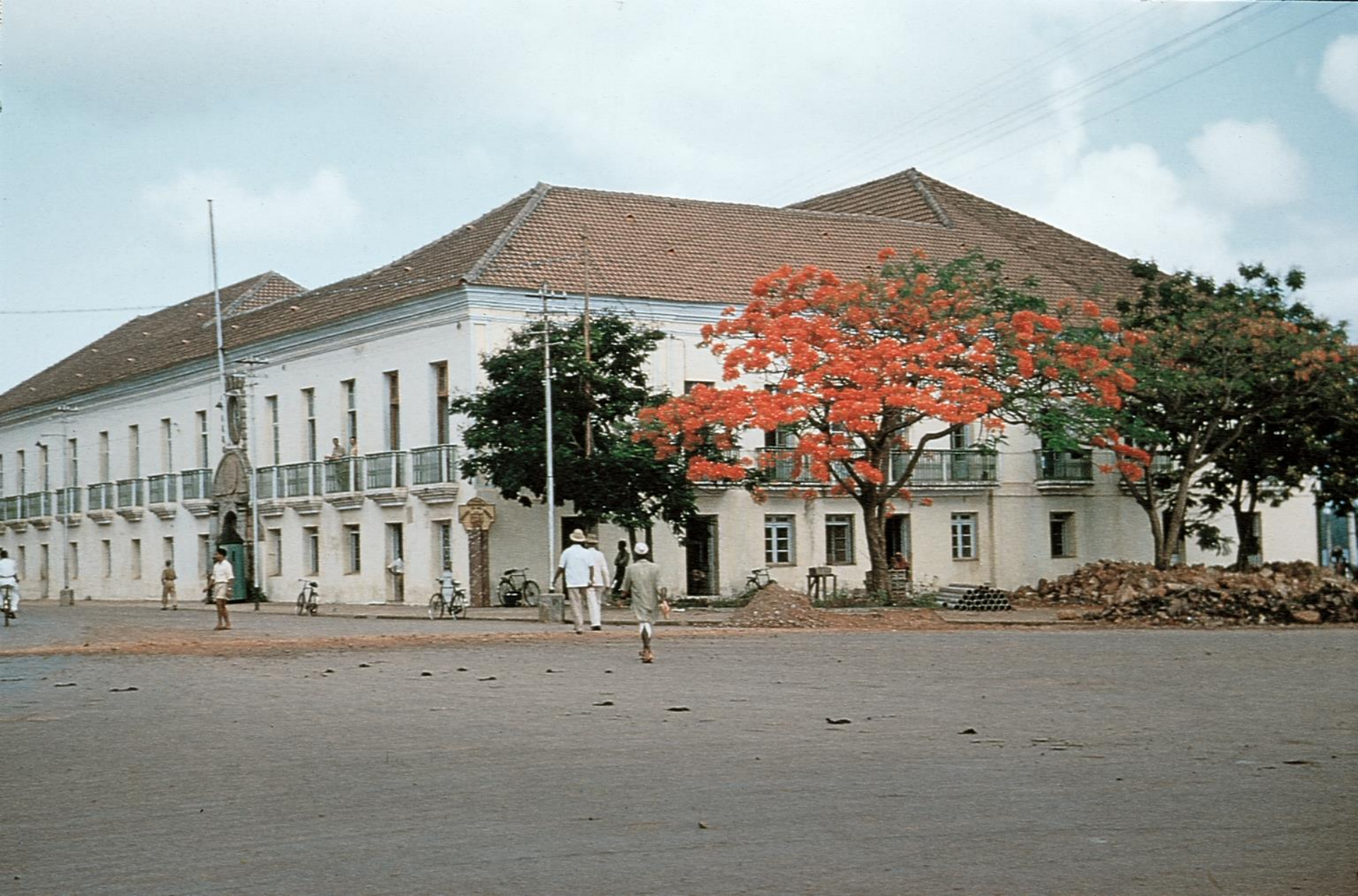
Pangim – antigo palácio do Hidalcão (1955)