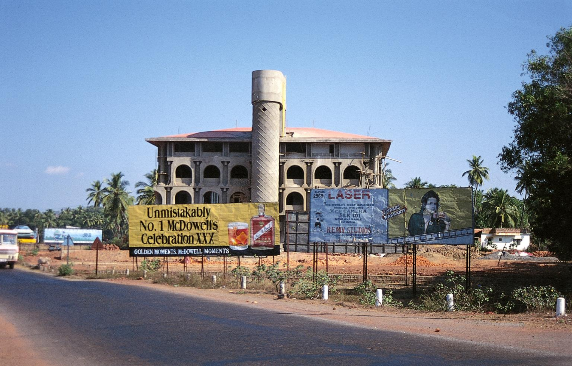
Bardez, estrada de Betim – um dos edifícios para a futura cidade administrativa (1996)