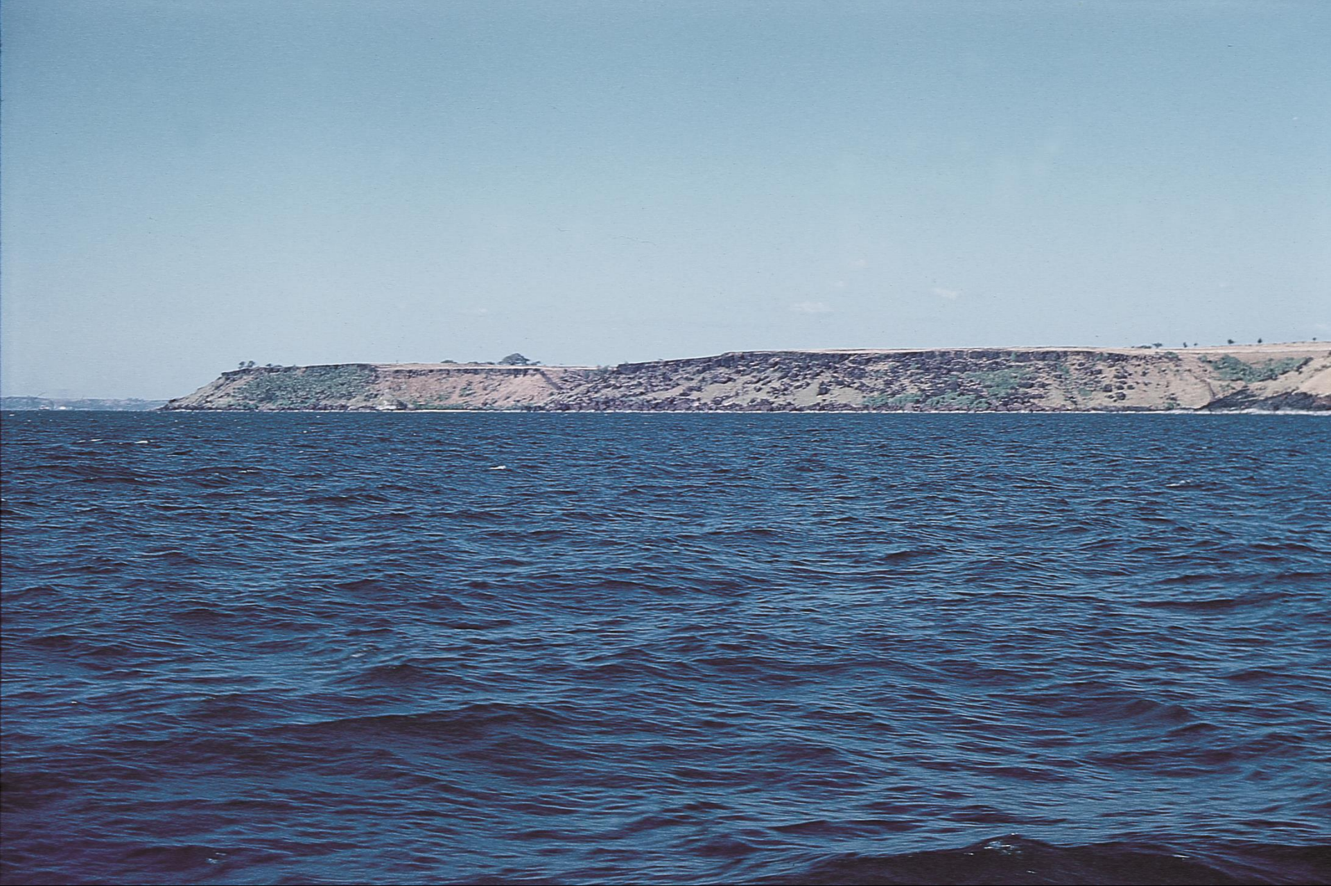
Plataforma laterítica de Mormugão (1955)