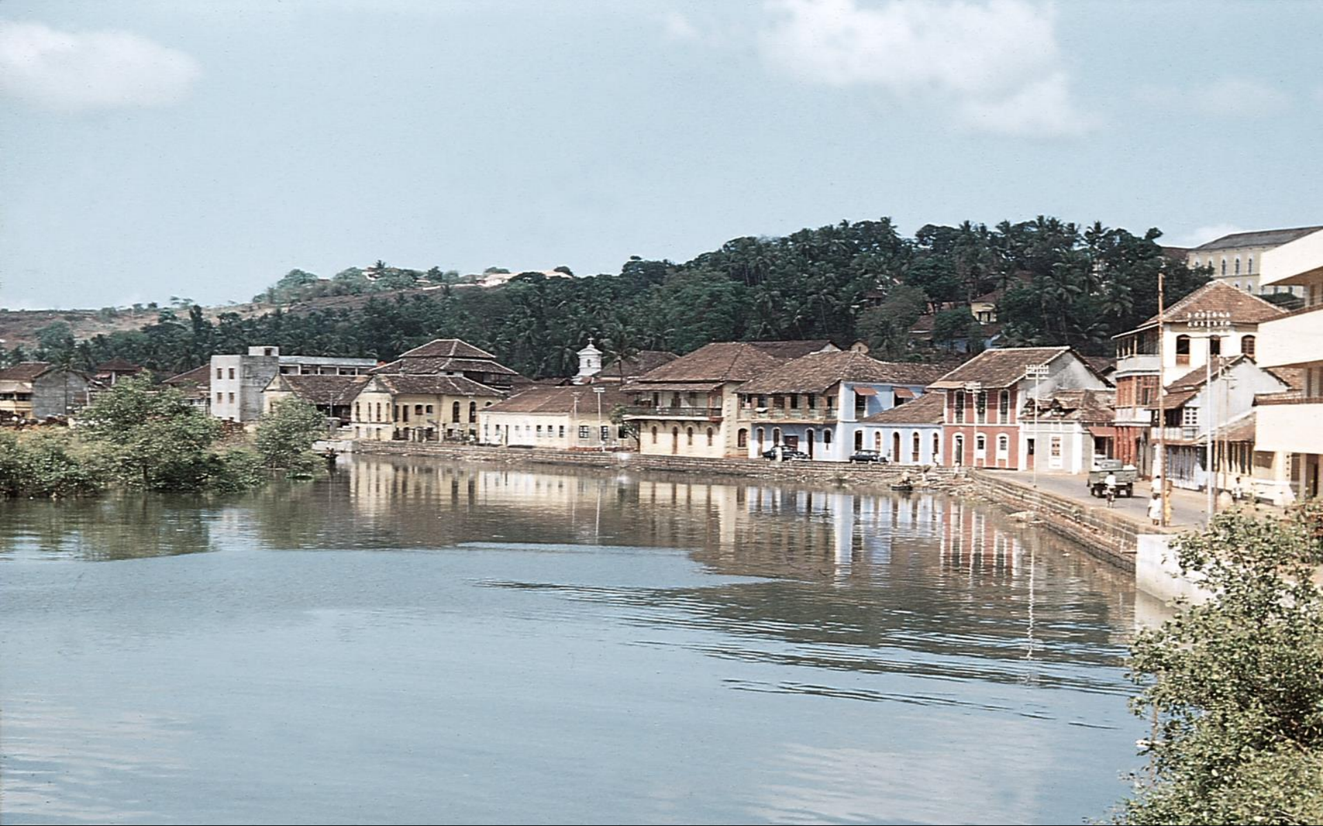
Pangim – Fontainhas, o bairro mais português da cidade (1956)