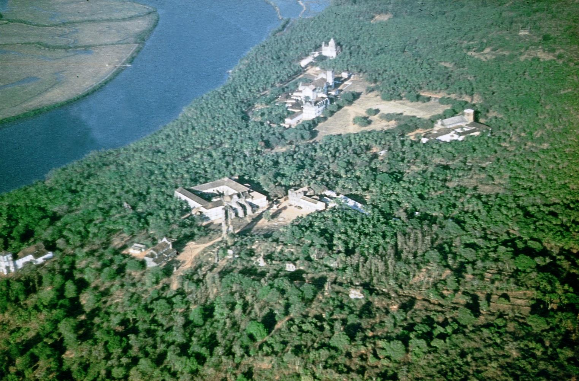
Vista geral de Velha Goa (1955)