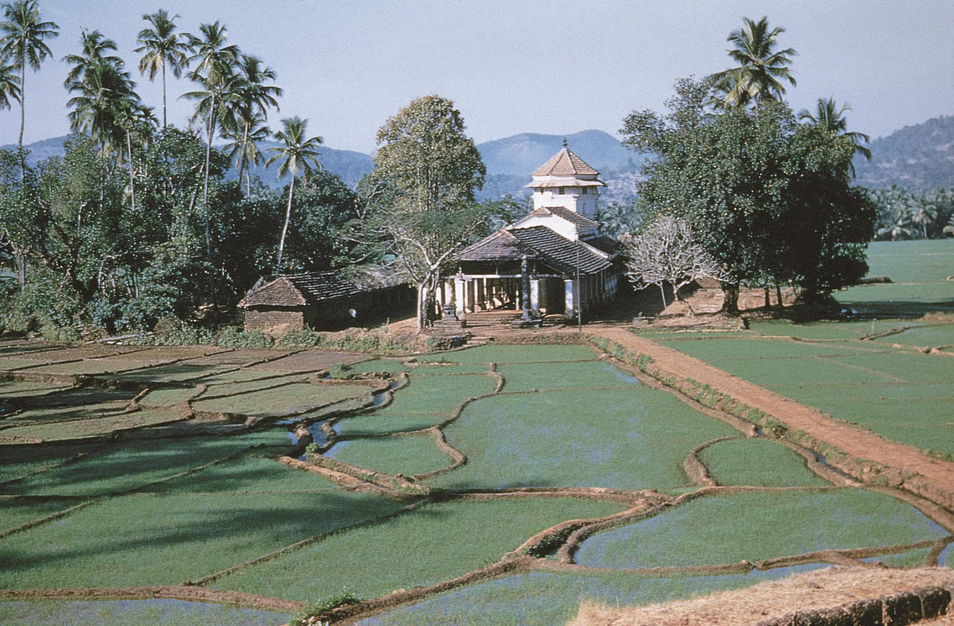
Pondá – várzea do templo de Siridão (1956)