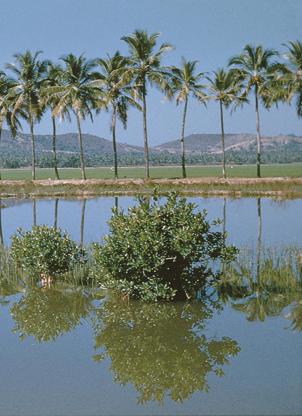
Bardez – rio, várzeas e coqueiros